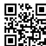
つうえんポータル

右記の二次元コードを読み込み、つうえんポータルにアクセスし、その画面にて「平内町」を選択し、利用申請をしてください。