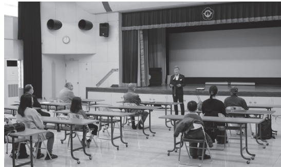
▲ハクチョウ検定の様子

来年度も同時期にハクチョウ検定を開催する予定ですので、まだ受験したことがない方はぜひ挑戦してみてください。