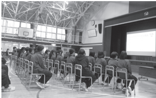
▲性の多様性について学ぶ生徒たち

生徒たちが将来関わる人に対し、偏見や差別なく、相手を尊重して接することができるようになることを願っています。