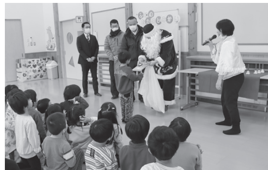
▲サンタから園児へ絵本が手渡されました

また、ひらないDreamライオンズクラブから東和保育園へ絵本が寄贈され、園児たちは嬉しそうな表情を見せていました。この取組みは今回が初めてですが、今後は町内のほかの保育園や幼稚園でも実施し、継続事業として取り組む予定です。