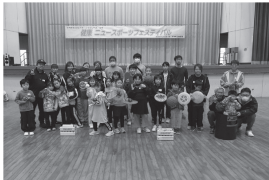
▲ニュースポーツを楽しんだ参加者の皆さん

また、イベントの途中にはDanceダンスACEによるダンス披露もあり、会場は大いに盛り上がりました。今後も、さまざまな軽スポーツを取り入れたイベントを開催する予定ですので、皆さまの参加をお待ちしています。