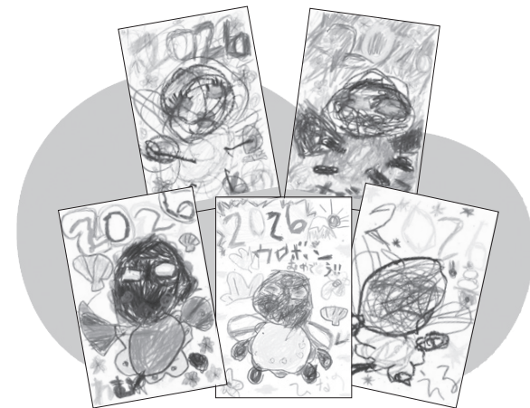
▲ウロボンのイラスト付き年賀状

12月17日(水)には、山彦幼稚園の園児がウロボンへの年賀状を投函するために小湊郵便局を訪れました。園児たちは年賀状の投函のほか、日頃郵便物を配達している郵便局員へ感謝の言葉を伝え、心を込めて書いた年賀状をポストに投函していました。届いた年賀状には、「イベントでの活躍を楽しみにしています」「たくさんの勇気をいただきました」など、温かい応援メッセージが添えられていました。