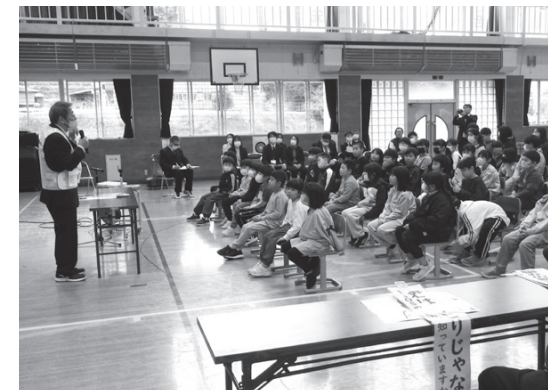
▲人権擁護委員の話に耳を傾ける児童たち

人権擁護委員からは、「あなたの周りには、相談できる信頼できる大人がたくさんいます。不安や悩みがあるときは、自分でSOSを出して必ず助けを求めてください。助けを求めることで、きっと解決への道が見えてきます」と呼びかけました。