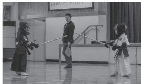
▲緊張感が漂う中、竹刀を構えて向き合う選手