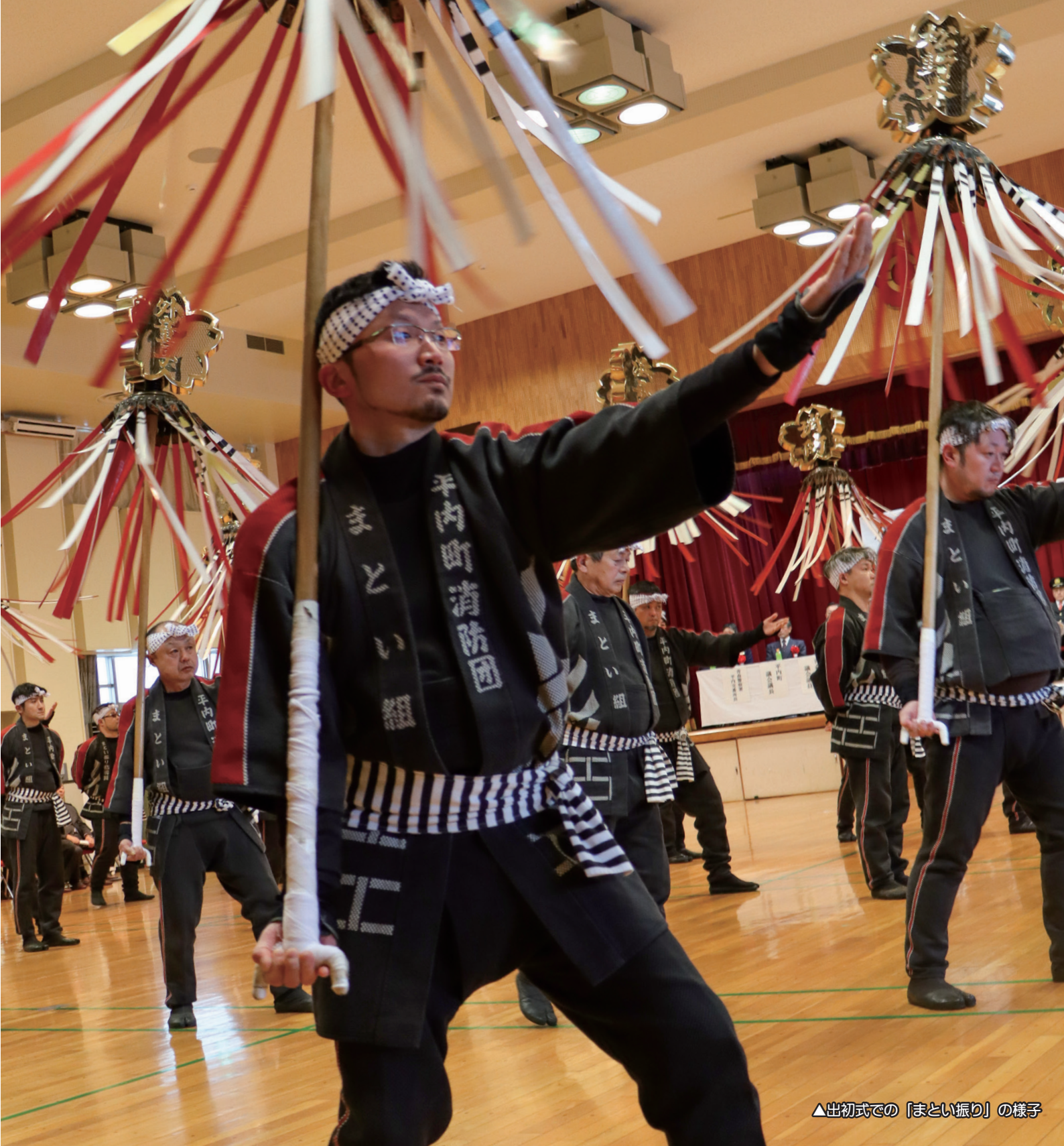
△出初式での「まとい振り」の様子