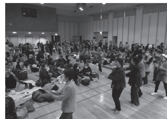
▲「どだればち」を踊り、一体となって盛り上がる会場

芸能大会の最後には、全員で「どだればち」を踊り、会場が一体となって大いに盛り上がりました。