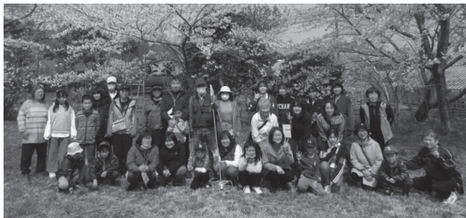
▲親子グラウンドゴルフ大会の集合写真

ひらない中央児童館では「 新年度登録児童 」を募集しています。児童館では、希望者に習字、珠算教室などの指導を行っているほか、親子バス遠足、夕涼み会、児童館まつりなどの楽しい行事もたくさん開催しています。登録申込書は児童館に設置していますので、皆様のご登録をお待ちしています。