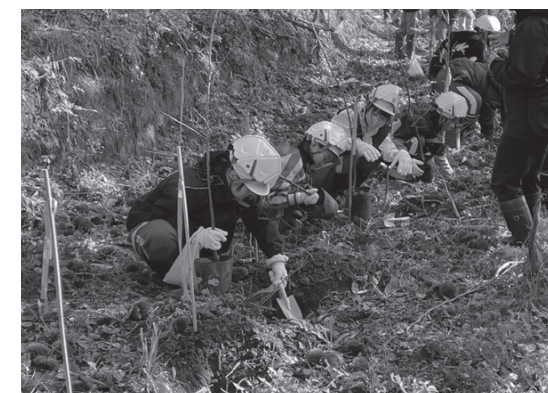
▲丁寧に苗木を植える児童たち

10月30日(木)、町内の小学4年生約50人が夜越山オートキャンプ場北側に、サクラ、ウメ、アンズ、ブルーベリーの苗木を合わせて140本植えました。