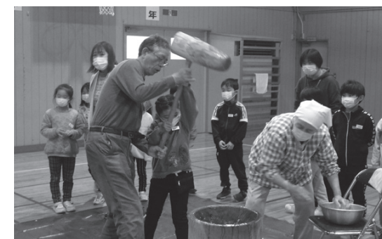
▲昔ながらの餅つきを体験する児童