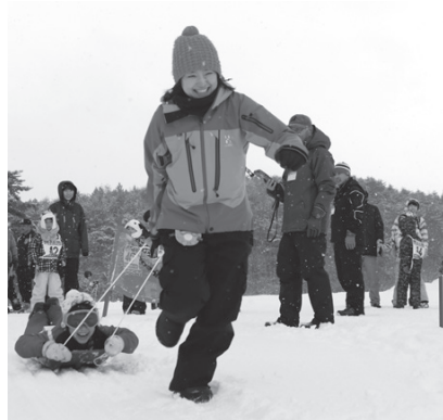
▲親子&ペア人馬そり引きレース

ホタテを入れる万丈箆に2人1組で挑み、1人が箆に乗り、もう1人が押して速さを競うレース