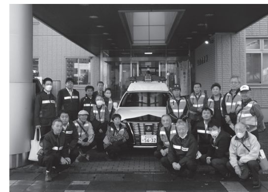
▲合同訓練研修会の参加者の皆さん

また、警察官が使用する防弾チョッキや防弾ヘルメットなどを触察した際には、その重さに驚く参加者の姿も見られ、防犯協会は「関係機関と協力し、安全で安心して暮らせるまちづくりを支えていきたい」と話していました。