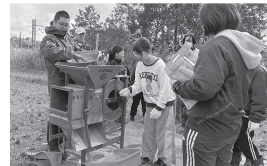
▲唐箕を回して、もみ殻と米を選別する体験に挑戦

児童たちは、一連の体験を通して米作りの大変さや食の大切さを改めて実感した様子でした。