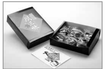
↑「風雪三昧」一度ご賞味ください

また、同様に竹山生誕100年を電車の利用客に広く周知しようと、商工会女性部と協力して整備したJR小湊駅前の花壇についても現場で活動紹介し、知事から激励を受けました。