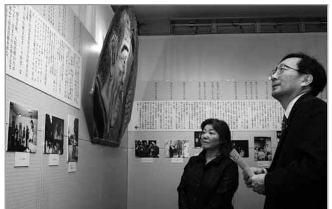
↑高橋竹山特別展を鑑賞に訪れた三村知事