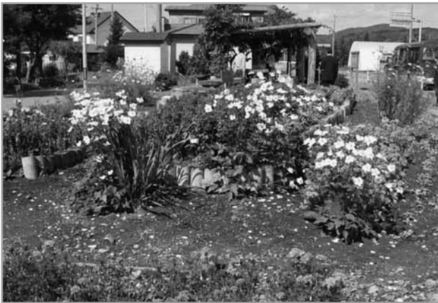
↑ 昨年「団体の部・優秀賞」に輝いた東和町内会

問 平内町教育委員会 教育課 7 5 5 - 2 5 6 5 (内線: 3 5 4)