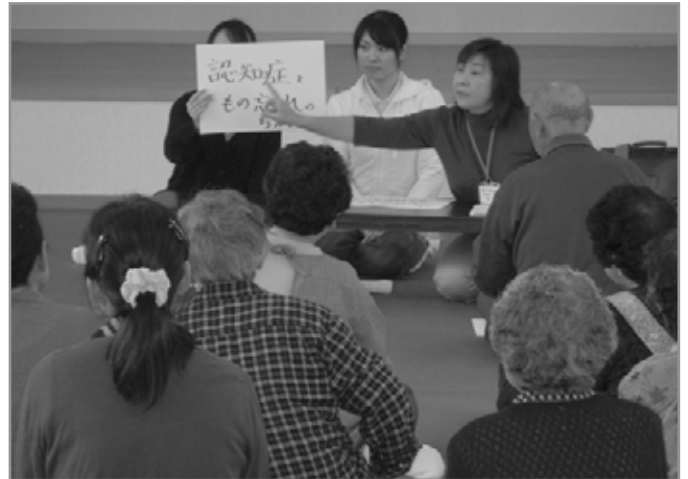
↑昨年、浪打町内会で行われた「認知症の予防と対策」講座