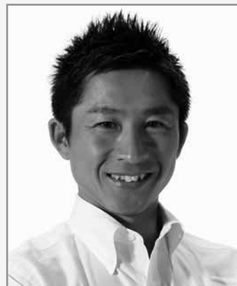
五輪金メダリスト 荻原健司さん