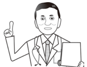
稲葉院長からも お願いします！