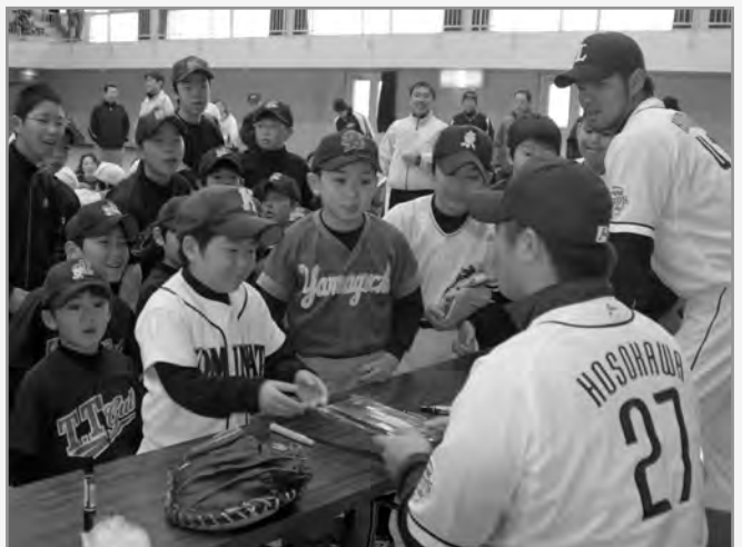
↑3選手からのプレゼントが贈られる