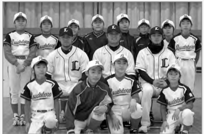
↑3選手と記念撮影(浅所小学校)