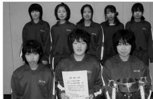
← 中学校女子団体優勝の小湊中学校チームの皆さん

東栄小学校女子チームは、平成22年2月27日(土)に県武道館で開催される青森県大会へ当町代表として出場します。優勝目指して頑張ってください！