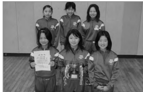
← 小学校女子団体優勝の東栄小学校チームの皆さん