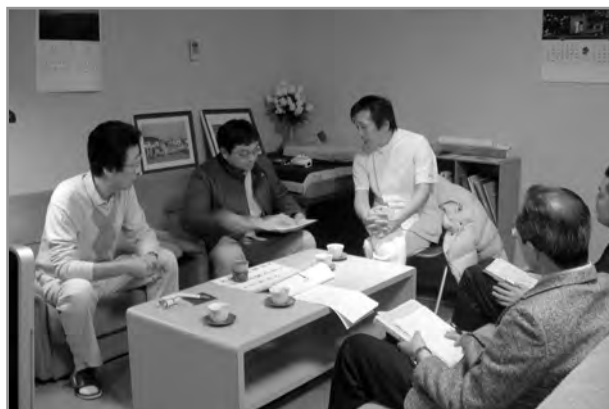
↑ たざわクリニックでの打合せの様子

町内の医療機関は、今後も予防接種体制の構築のみならず「町民の健康を守るため」一致団結し、協力し合っていくことを確認しました。