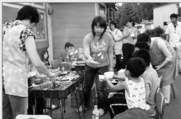
↑ 友達もたくさんできるよ！