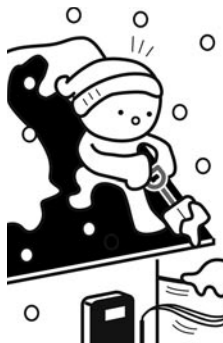
(財)東北電気保安協会

◆戦没者遺族相談員 戦没者遺族に係る各種年金、給付金等受給に関する相談、戦没者遺族の生活上の問題に関する相談、指導