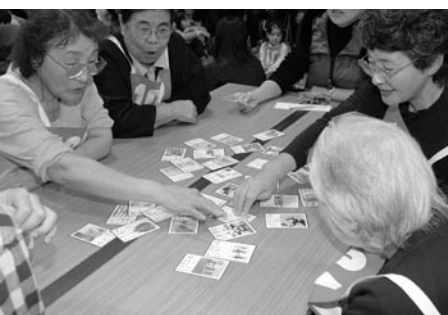
↑シニアの部はテーブルの上で行いました