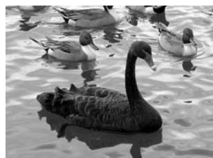
↑こちらが「コクチョウ」

コブハクチョウは、オオハクチョウの幼鳥の大きさと、くちばし上部の付け根に黒いコブのような裸出部があり、名前の由来になっているそうです。