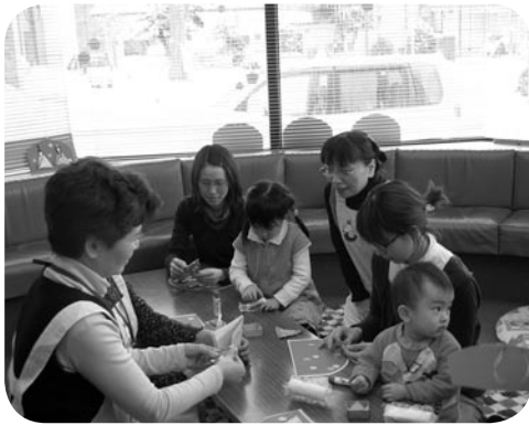
↑「雛祭り」上手にできたかな？

子育てサポートセンターで主催した「ひな祭り」が2月28日に町立図書館で町内から5組10人の親子が参加して行われました。この日は、サポーターによる紙芝居の読み聞かせのほか、親子で折り紙を使った手づくりの雛飾りを作って楽しい時間を過ごしていました。最後に雛あられとジュースが配られ、一足早いひな祭りの雰囲気味わっていました。