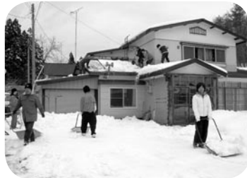
↑皆さんの善意に感謝します

が2月9日に小豆沢地区、23日に山口、藤沢、平中地区で行われました。 この事業は、平内高校の除雪ボランティアと地域住民が共同で一人暮らしの高齢者宅を訪れて除雪作業を行いながら、住民による住み良い地域づくりを推進することを目的に行われています。小豆沢地区で行われた除雪作業には、町内の方15名と平内高校の生徒5名が参加して、屋根の雪下ろし、家の周りの雪を除雪しました。この日は、文部科学省の調査官と青森県生涯学習課の職員が視察に訪れ、ボランティアの皆さんと一緒に汗を流して除雪作業を体験していました。隣で作業を見守っていたおばあさんは「雪片付けの出来ない高齢者にとっては、とてもありがたいことです」と何度もお礼の言葉を述べていました。