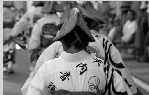
↑ 華麗な踊りを披露した平内音頭流し踊り