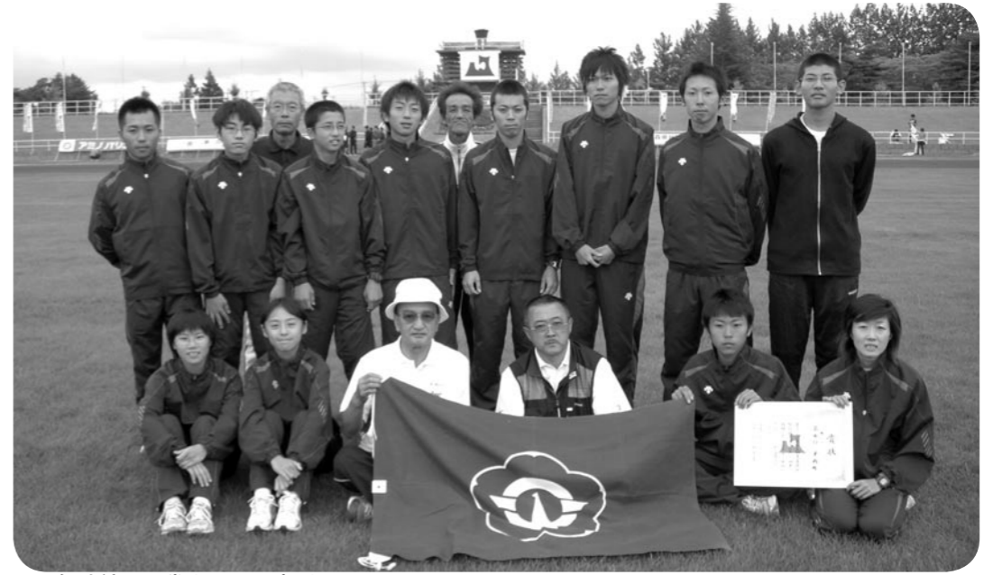
↑2年連続で入賞を果たし喜ぶ選手のみなさん