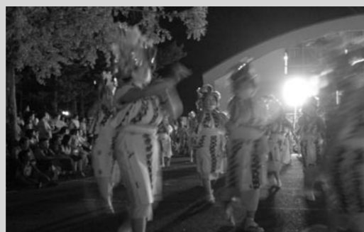
↑ 息の合った踊りを披露