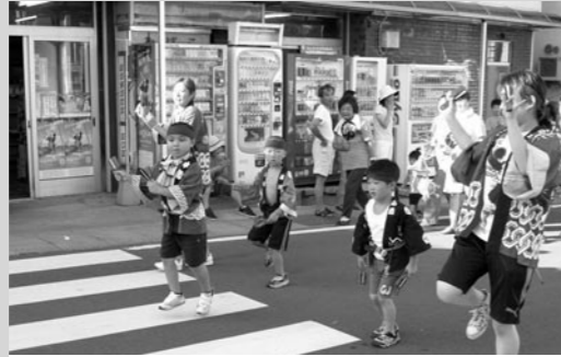
↑ 保育園児による「よさこいソーラン」