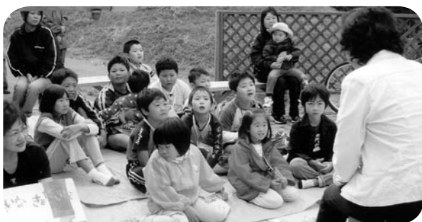
← みんなの顔が真剣です

夏休み中の7月30日と8月23日に浪打地区で子どもたちに民話や紙芝居を楽しんでもらうために、読み聞かせ会が行われました。朝のラジオ体操に集まった子どもたちが、海にきらめく朝日を浴びながら、普段聞くことのない外での朗読に一人ひとり耳を澄ましていました。