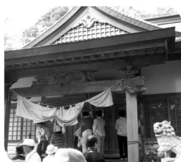
↑ 狩場沢 関口「熊野宮」