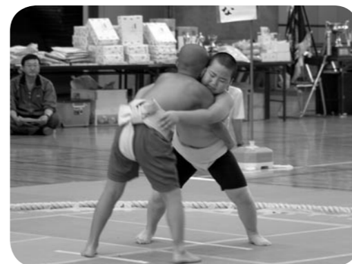
↑まわし姿が妙に似合っている?

をスタートした県内40市町村のランナーが郷土の誇りを懸けて8区間33.8キロを1本の襪でつなぎました。当町は、1区から安定した走りで最終8区までつなぎ、総合で13位、町の部では2年連続7位入賞を果たしました。