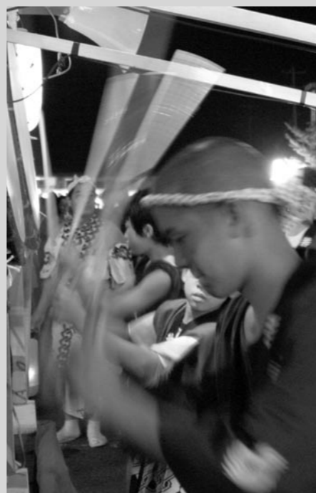
↑ 豪快なバチさばき