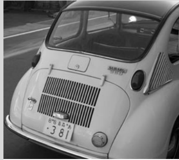
↑ 往年の名車が勢揃い