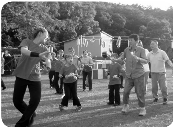
← 鳴子を手に入所者も一緒にドッコイシヨ