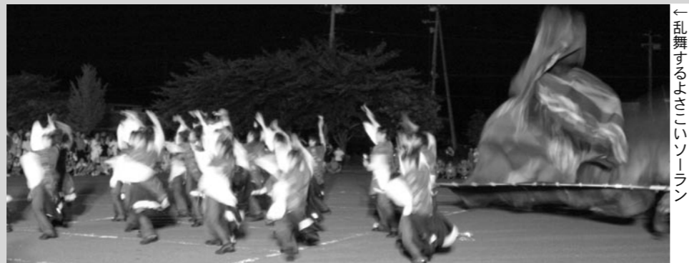
↑ 乱舞の心大町「乱舞」