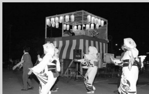
↑ たくさんの人で賑わった盆踊り会場