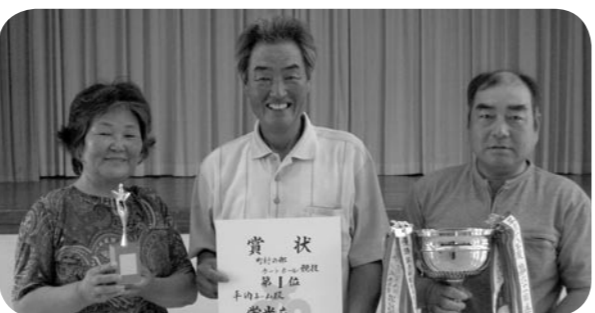
← 初優勝おめでとうございませす

7月28日にむつ市を会場に行われた第62回青森県民体育大会ゲートボール競技に出場した「平内町ゲートボールチーム」が日頃の練習成果を発揮して、予選リーグをトップで通過、2回戦では東北町、準決勝では佐井村、決勝では田舎館村をそれぞれ破り見事初優勝を飾りました。