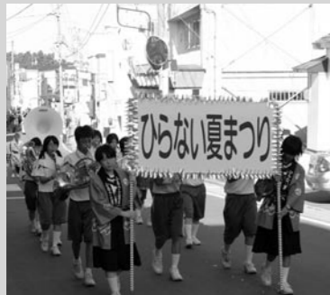
↑ 小湊中学校プラスバンド部