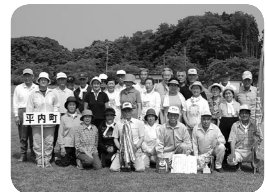
↑ダブル優勝おめでとうございます

防犯、体育協会主催の「防犯・町民相撲大会」が8月9日に町立体育館で行われ、団体戦、個人戦、勝ち抜き戦に幼児から小学6年生までの男女76名のチビッコ力士が参加して熱戦を繰り広げました。土俵では、女の子が男の子を豪快に投げる気迫ある取組みに観客から声援や拍手が送られていました。