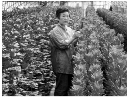
↑毎日欠かさず手入れをします

花卉栽培を始めたのは、昭和58年まで栽培していた杉苗の価格低落に伴い、仲間に勧められて3ヶほどの菊の露地栽培に取り組んだところ、思いのほか高い収入を得ることができたことが本格的に取り組みきっかけとなりました。 毎年少しずつ経営面積を拡大して、現在、28ヶの畑で「菊」「トルコキキョウ」を栽培しています。花卉栽培の作業工程は、5月中旬頃から7月中旬頃まで定植が行われ、7月下旬から12月末までが収穫の時期となります。出荷量は菊が約40,000本、トルコキキョウが約1,600本ほどで、主に県内や札幌方面に出荷しているほか、直売所での販売も行っています。