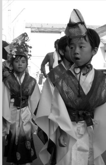
↑ パレードで行われた稚児行列