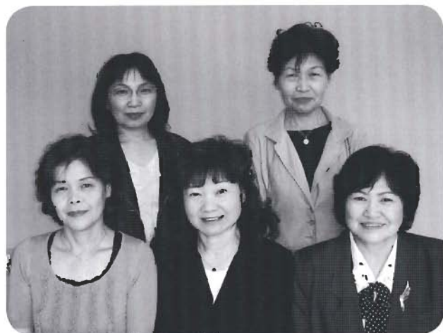
↑私たちがサポートします