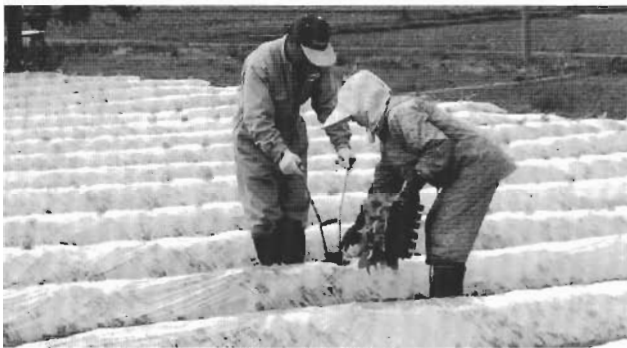
↑手間がかかりますが楽しいですよ