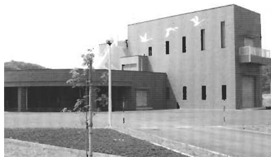
↑昨年完成した平内浄化センター

用開始しています。これにより平内町の住民の約50%が下水道へ加入可能となっております。