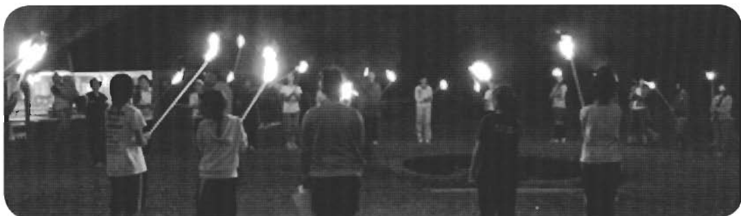
↑キャンプファイヤー「幻想的です」