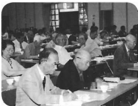
↑一句一句心をこめて