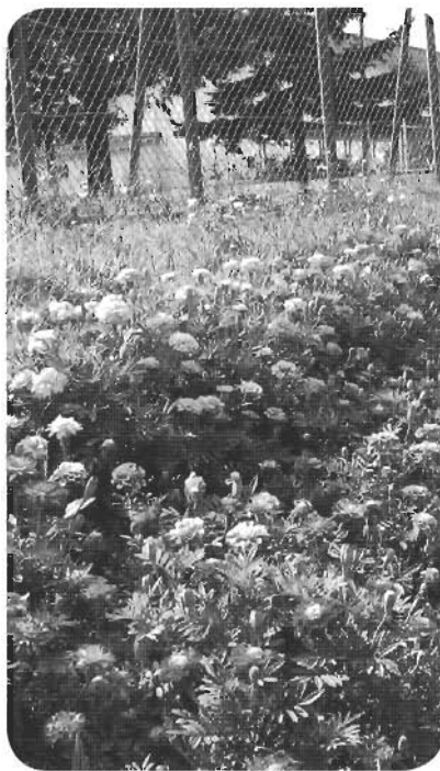
↑平内高校前の花壇(昨年度)