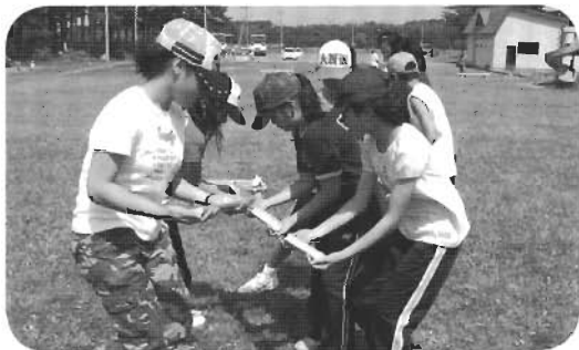
↑誰か、そっち持って