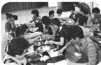
↑美味しくいただきました

生涯学習の人材バンクを利用した料理教室が、教育委員会の職員を講師に稲生漁民センターで開かれました。この日は「漁業で忙しい家庭でも、簡単に作れる料理」という内容で、集まった漁協婦人部の皆さんが、「簡単花寿司」のほかに茄子を使った「はさみ揚げみぞれ煮」や「海老と茄子の香り揚げ春巻き」ジャガイモを使った「菊の酢和え」などの料理を作り、出来上がった料理をみんなで食して感想を述べ合っていました。