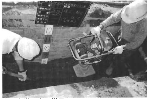
↑下水道工事の様子

公共ますは、下水道と排水設備を接続するためのもので、町が使用者の敷地内に設置して管理します。 生活排水設備は、供用開始から1年以内に設置しなければならぬことになっております。また、トイレの水洗工事は、下水道法で3年以内に実施しなければならぬと定められています。