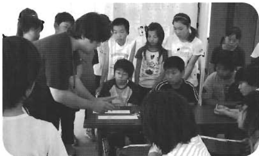
↑どうやって作るのかなあ、全員真剣顔です

やイニシアティブゲームなどを行い、ゲームを通じてチームワークの大切さを学んでいました。この日の夜は、飯盒で炊いたご飯と梵珠カレーをお腹一杯食べた後、キャンプファイヤーやレクリエーションをして夜遅くまで楽しんでいました。最終日は、自分たちでテントを片付け、朝食の後、パークゴルフを楽しみました。子どもたちは、二日間の研修を通じて、協力し合うことや、仲間を思いやることの大切さを学んだようです。