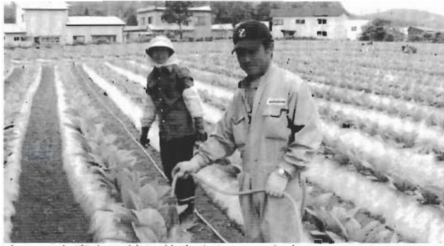
↑いつも妻と一緒に仕事をしています