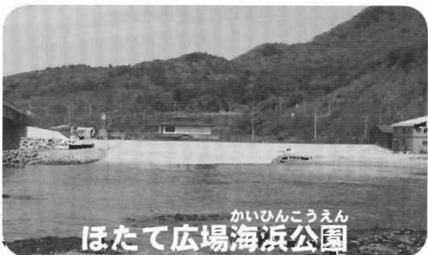
かいひんこうえん ほたて広場海浜公園