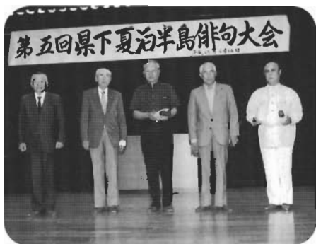
↑入賞おめでとうございます