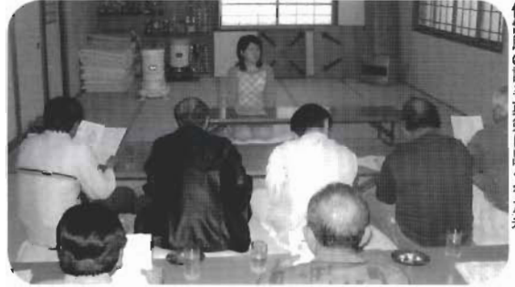
保健師の話を実例に聞く参加者

松 風塾・平内高校のボランティアの皆さんも参加して白鳥ホーム室内レクリエーションが3月15日、白鳥ホーム体育館で行われました。この日は、今話題のカーリング競技を楽しみました。キャスト付きの鉢置きに乗った漬け物石のストーンをサークルめがけ放つのですが、あっちへ曲がったり、こっちへ曲がったり、コツがつかめず四苦八苦する姿にまわりの人たちも大爆笑しながら、楽しい一日を過ごしていました。