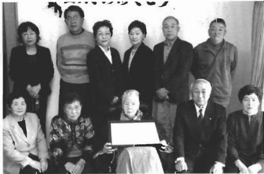
↑子どもにたちに囲まれ喜ぶチャヤさん(写真中央)

チャヤさんは、明治40年3月15日生まれで、子ども6人、孫16人、ひ孫24人、玄孫5人とたくさん家族に恵まれました。この日は、久しぶりに集まった6人の子どもの全員に囲まれて、孫たちから贈られたバースデーケーキのローソクを勢い良く