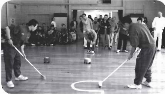
微妙な力加減が難しいところ…