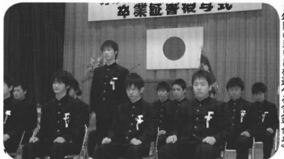
3年間の思い出を述べる(重井内中)

ひ らない体験活動推進協議会で実施してまいりました、ぶっくるんセンター(ひらない子ども教室)が3月で一旦終了することとなりました。平成16年から町立図書館を活動拠点として、毎週水曜日の午後3時から小学生を対象に絵本の読み聞かせや手づくり体験活動など、様々な活動を展開してきました。3年間の短い期間でしたが、たくさん子どもたちに参加していただきました。ありがとうございました。