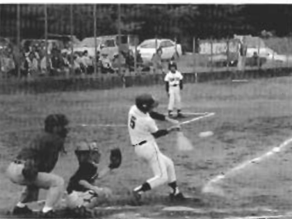
▲ナイスバッティング