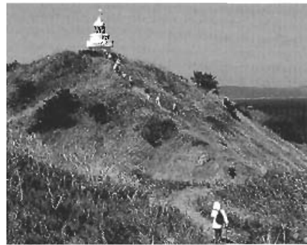
▲夏泊の風をうけて大島灯台をめざす

当日は、晴天に恵まれ、樺山から大島灯台を經由し久慈ヶ浜までの約5Kを歩きました。陸奥湾からの心地よい風を全身に受け、日本の渚百選に選ばれた樺山海岸をスタート。俳句を刻んだ石碑を見ながら夏泊遊歩道を歩き、大島灯台へと足を運びました。そこから見渡す眺めは右手に下北半島、左手に津軽半島、中央遠くにはかすかに北海道の地が見え、参加者一同その景観のすばらしさにしばし言葉を失いました。景色を楽しみながらの昼食の後、大島から久慈ヶ浜まで歩き、バスにて帰路につきました。