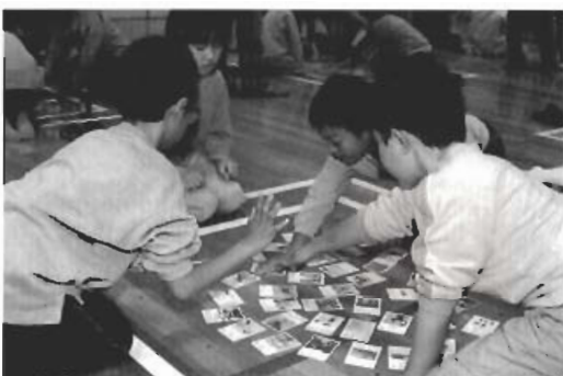
▲「ハイッ」僕がいただき