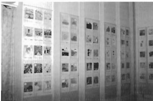
▲小学生が描いた絵札の展示