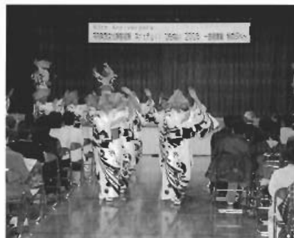
▲連合婦人会による平内音頭