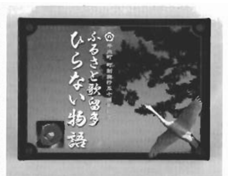
▲りっぱな箱が出来ました