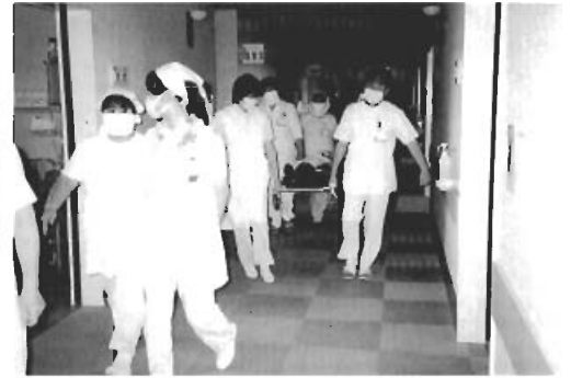
▲患者を担架に乗せて避難場所まで急げ