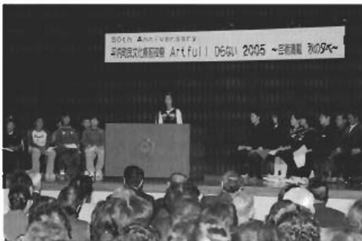
▲メッセージを述べる出演者