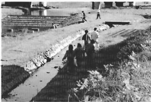
▲小湊川周辺を清掃する2年生の皆さん