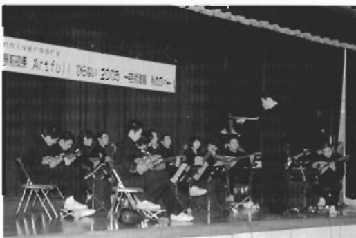
▲松風塾高校生徒によるマンドリン演奏のようす