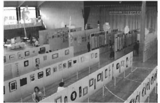
▲完成度の高い作品がズラリ

そのほか、囲碁・将棋大会や平内町健康展も同時開催され、文化の秋の日に充実した二日間でした。