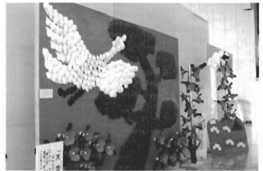
▲ホタテ貝殻のオブジェ(平内高校生徒制作)