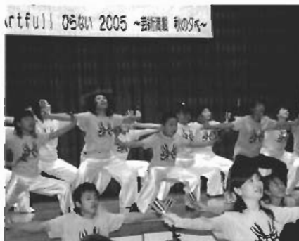
▲よさこいユニット「威舞綺」の平内音頭