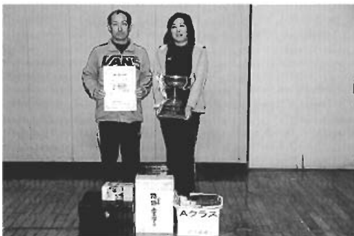
▲優勝しました。商品がいっぱい、どうしよう...