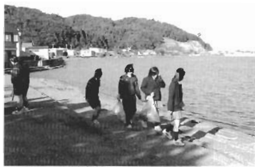
▲浅所海岸はとてもきれいになりました

「みちくさボランティア」は、ボランティア委員だった卒業生のヘルパーさんに出会って、声をかけてもらうことも多くなりました。「みちくさ」が着実に地域に根ざしてきています。今もボランティア委員たちは毎日情報交換をし合って、こつこつと活動を積み重ねています。平内高校では、これからも思いやりの輪を平内町全体に広げ、笑顔で出会える、明るく温かい地域づくりに協力していきたいと思っています。