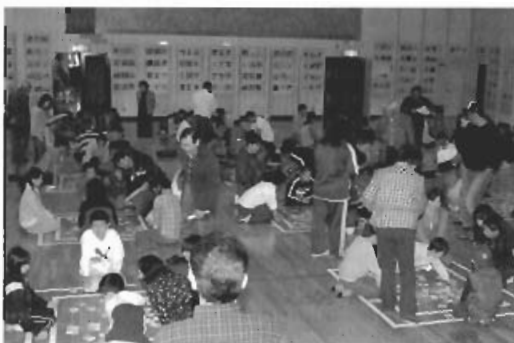
▲試合開始前みんな気合十分です