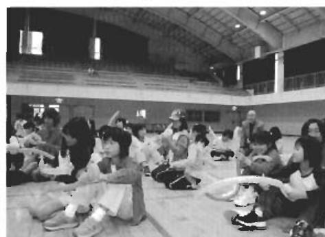
▲マジックバルーンで剣づくりに挑戦!!

ら教えてもらったり、ボランティアの平内高校・松風塾高校生と遊んだりしました。集まった120名の子どもたちは、地域のいろいろな大人や子どもとふれあい、楽しい一日を過ごしました。