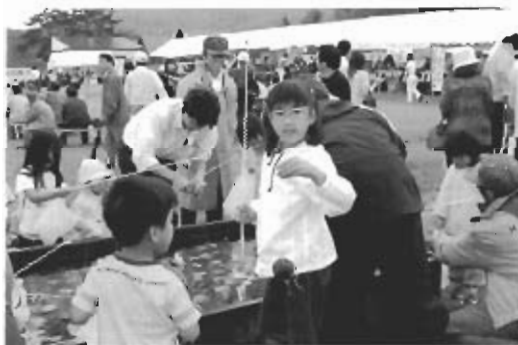
▲見て、見てうまく釣れたよ(夜越山会場)