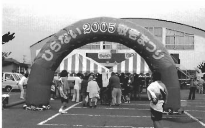
▲大勢の方が参加してくれました。