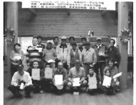
▲賞状をもらっちゃいました(パークゴルフ)