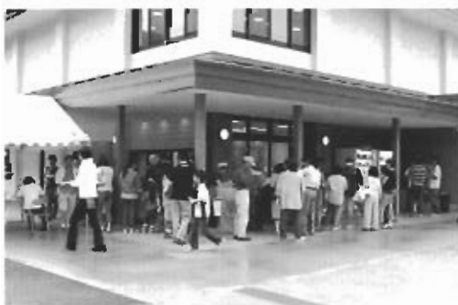
▲貝焼きまだかなあ(ほたて広場会場)