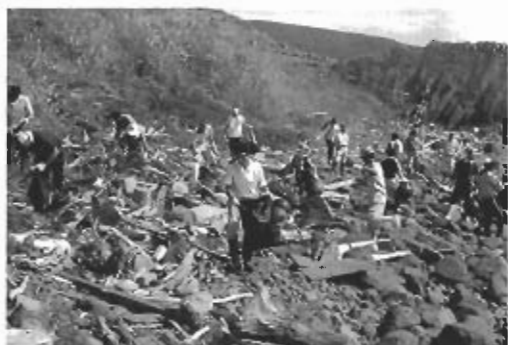
▲漂着したゴミが多くて大変でした。

船橋会長は「流れ着くゴミの量には改めて驚かされました。しかし私たちの大切な海ですので、ぜひまたこのような機会を設けて、海をきれいにしていきたい」と話していました。