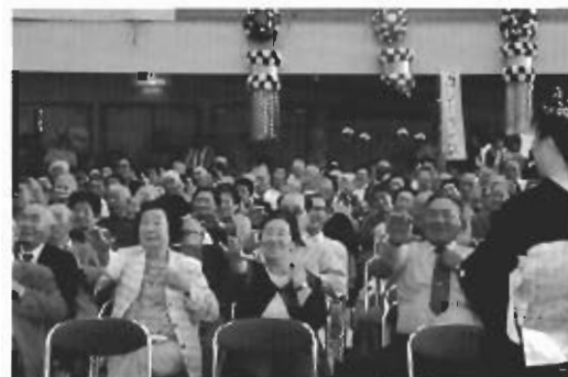
▲いっち、にい、いっち、にい(ピンピン体操)