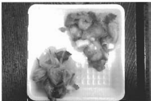
▲新商品?ナマコの和え物(ほたて広場会場)

また、今年上屋地区にオープンした「ほたて広場」でもイベントが行われ、漁協女性部による、「ほたての具入りおにぎり」や「ほたて入りそば・うどん」の販売やナマコに長イモやナメコなどを混ぜ合わせた和え物が試食として振舞われました。