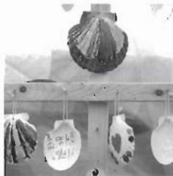
▲貝殻のアート作品