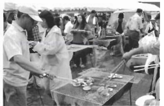
▲こうやって食べるのが1番(夜越山会場)