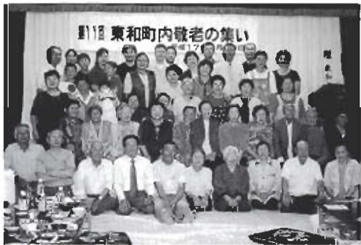
▲当日集まった東和町内会のみなさん

「各町内で、敬老会を開き、地域の先輩たちをお祝いすることが敬老の精神なので他の町内でも実施するようにがんばりたいのに」と飯田町内会長が話していました。