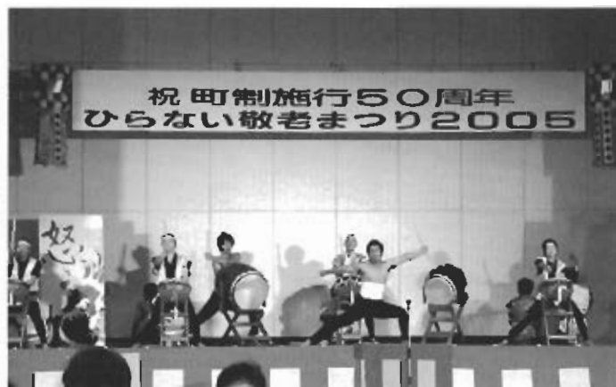
▲オープニングを飾った勇壮な清風荘太鼓

「敬老会」について 敬老会について、町民の方々からいろいろなご意見があります。町では一昨年まで満75歳以上の方を招待して「敬老会」を開催してきました。 昨年は本格的な高齢化の進展により、対象者の急増や参加される方々が広範囲にわたるため送迎に時間がかかること、更に最も懸念された身体的負担等を考えあわせ、関係者の意見も聴き検討した結果、地域コミュニティの大切さを図るうえで、各町内で地域ぐるみでお祝いすることが、最も望ましい敬老行事のあり方であるとの結論になりました。 しかし、町主導による一堂に会しての敬老会を取り止めたことを受け、町民有志が呼びかけし、ボランティアによる実行委員会を立ち上げて「ひらない敬老まつり」が、今迄と同様に体育館で実施されました。 これに対し町では、75歳以上の方全員に記念品を、また90歳以上と88歳(米寿)になった方、夫婦で75歳以上になった方々へは、特別記念品を贈呈したほか、施設の使用、送迎バスの提供、職員の出発等出来る限りの支援を行いました。 今年も、子どもからお年寄りまで楽しめる住民参加型の「ひらない敬老まつり」を「民」と「官」が協働して実施いたしました。町では実行委員会へ補助金(40万円)を交付したほか、運営には前年度同様側面から出来る限りの支援を行っております。 以上のように、町が主催する「敬老会」ではありませんが、行政主導型から住民参加・主導型、すなわち「民」と「官」が協働して取り組むことが、今後の新たな「まちづくり」であるのではないかと考えておりますので、ご理解をいただきますようお願いいたします。 なお、一部の町内会では地域ぐるみでお祝いする「敬老会」を実施しておりますことを、合わせてお知らせいたします。