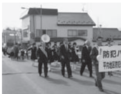
▲小湊町内をパレード

行きません」など5つの誓いを読み上げた。 このあと、小湊中学校吹奏楽部の演奏に合わせて防犯を呼びかけながら町内をパレードしました。