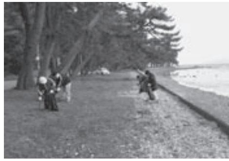
▲榎山海岸を清掃中

4月23日(土)町と町職員組合が一緒になって、町の環境美化運動の一環として続けている清掃奉仕活動が、今年度も夏泊公園線を中心にわれ、数多くの職員が参加しました。