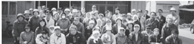
▲清掃活動を終えた沼館町内会の皆さん

り。風が強い日でしたが、活動後は「きれいな町になった。夏の清掃もまた、がんばろう」と話し合っていました。地域が協力して、きれいなまちづくりのために汗を流した1日となりました。