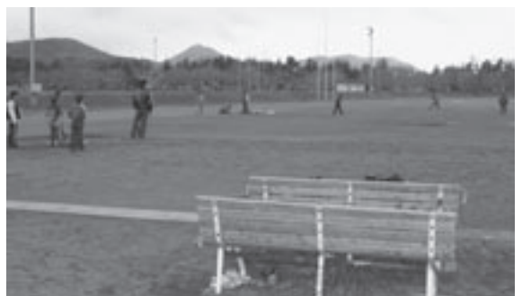
▲全員野球でめざすは優勝

(和)どの試合でも、自分の力を出し切って戦えるようになること。結果はおのずとついてくると思います。