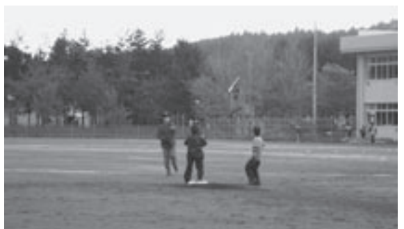
▲センターキャッチ、二塁ヘトス

そして根性のあるところ。声の大きさ、返事、全力で立ち向かっていく気持ちは、どのチームにも負けません。