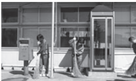
▲JR小湊駅前を掃き掃除する松風塾高生

道路脇は、雪解け後に現れた空き缶や木屑で汚れていました。また、今年初めて「わの市広場」周辺の清掃を行いました。