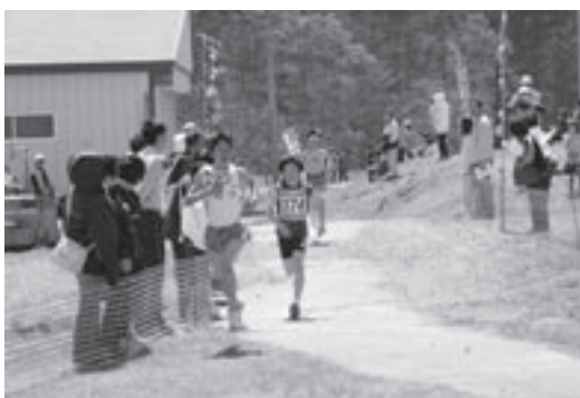
▲ゴール前のラストスパート