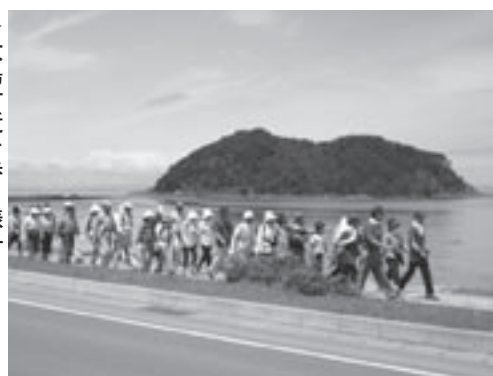
▶大島付近を歩く様子

注) ※印はバスでの移動区間 ◆参加定員 先着順130人 小学生は保護者同伴、中学生は保護者の同意が必要です。