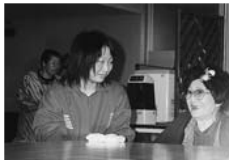
▲お年寄りの昔話に花が咲き、止まりません…

よりも元気でよく笑っていた」「これからは積極的にお年寄りと話をしていきたい」など、交流後の感想を楽しそうに話してくれました。