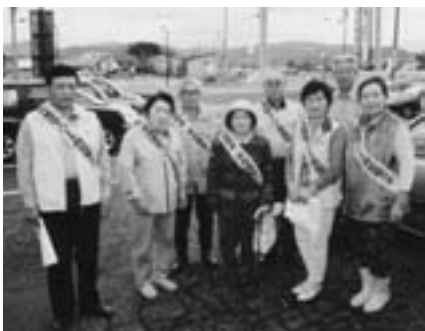
▲地道な見回りが、安全への第1歩です…