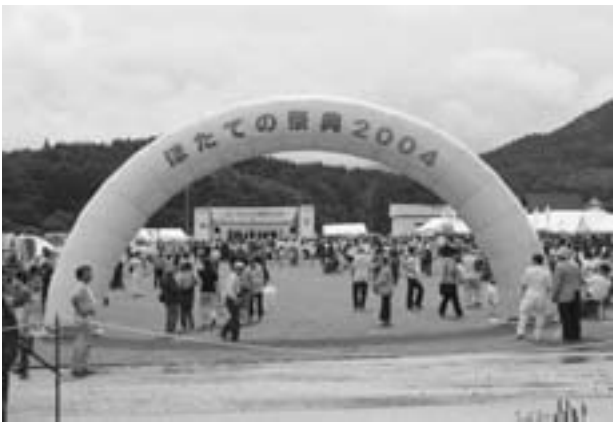
▲入口には、今年も巨大なエアアーチで来場者を迎えます