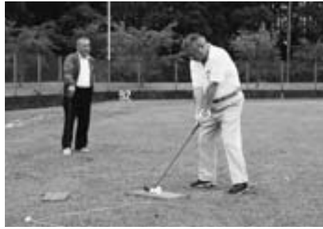
▲ターゲットバードゴルフってご存じですか？