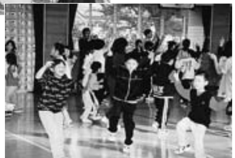
▶音楽に合わせて踊っていると、なんだかとても楽しくなってきました…