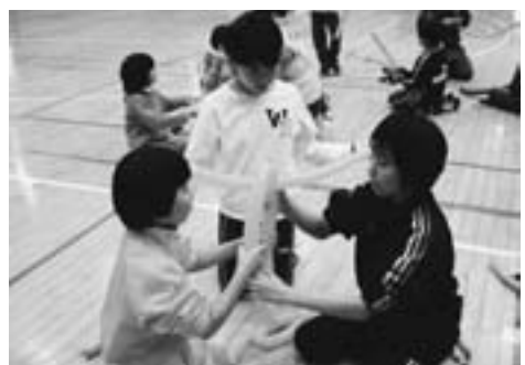
▲「割れるよ、コレ、怖い…」『割れないって!!』