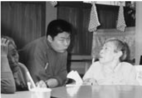
▲「あのね…」と中学生に話しかけるお年寄り

生徒さんは、ホームで暮らすお年寄り世代とは接点が少なく、どう接すればよいのかと不安な様子でしたが、「僕が皮をむいたリンゴを食べてくれて嬉しかった」「思った