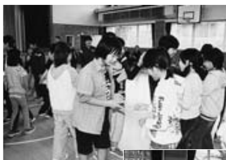
◀違う学校の人と握手をしてジャンケンをして…。相手の人数が増えていくうち、だんだんうち解けていきました

その後に行われたレクリエーションでは、ジャンケンゲームやフォークダンス、新しい学区の班ごとに分かれての綱引きなどで、学年や学校の隔てなく、顔を合わせては笑顔を見せるなど、親睦を深めた貴重な1日となりました。