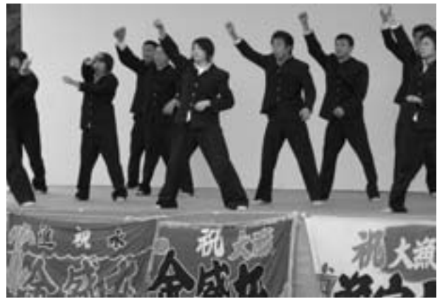
▲学ランで、勢いとキレのある「よさこいソーラン」を披露!!