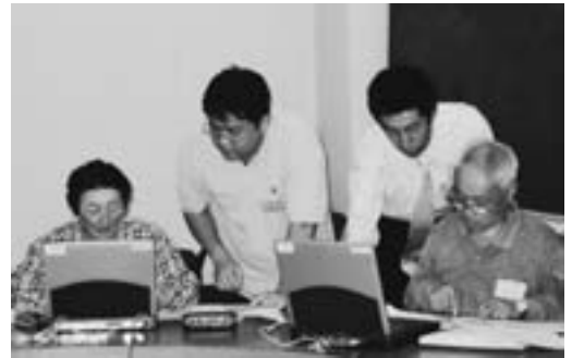
▲「すみません…?」「はいっ、これはですね…」

初めてパソコンにふれる方 も多く、初めはマウス操作も ぎこちなかった受講生ですが、