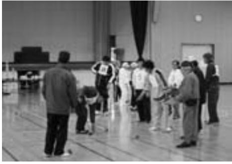
▲雨のため、体育館でのゲートボールでした

10月9日(土)、平内町営陸上競技場・町立体育館・夜越山パークゴルフ場を会場に、「町民スポーツの日」が行われました。当日は、あいにくの雨天でしたが、町民約150名が参加して、5種目の軽スポーツを楽しみました。各種目の結果は、次のとおりとなりました。