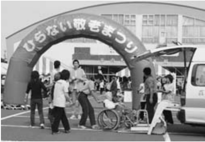
▲会場となった町立体育館前では、参加者への親切な対応が…

まつりでは、参加者を飽きさせないようにと、趣向を凝らしたクイズやゲームなど盛りだくさんの企画や、老人クラブ芸能部をはじめとした様々な会の発表に、拍手や笑いが絶えませんでした。また、ボランティアも延べ600人が集まり、参加者をもてなすために、細かいところまで目を