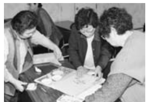
▲「ここをこうすればいいんじゃない?」

最初はサンプルを全員に配布して同じ物を作って、それをみんなで見て話し合っただけで、色彩感覚について勉強しました。