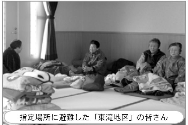
指定場所に避難した「東滝地区」の皆さん

地震直後、陸奥湾沿岸の津波警報、東日本太平洋沿岸の大津波警報発令という状況を踏まえ、17時43分には海沿いの15地区に避難指示を発令し、避難指定場所への避難を促しました。しかし、県内全域の停電により、庁舎内の電話・防災無線等が十分に使用出来ず、各地区や避難場所との連絡が困難となり、町職員をはじめとする関係機関が懸命に情報提供や、避難行動と場所等の指示などの対応に努めましたが迅速・的確に伝達できず、町民の皆さんには不安と混乱を招く状況となってしまいました。