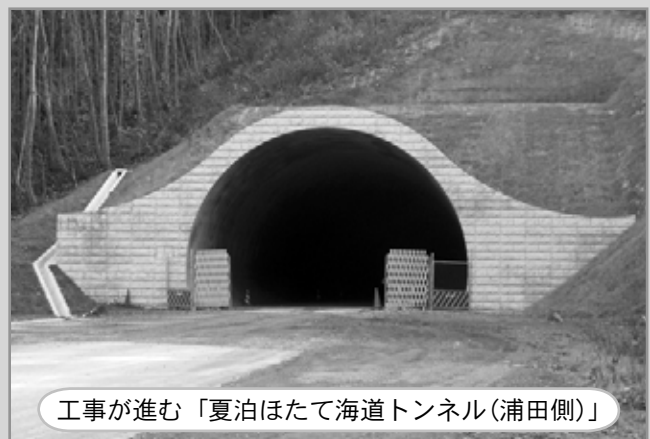
工事が進む「夏泊ほたて海道トンネル(浦田側)」

バイパスの早期完成を望むとともに、完成後にはトンネル前に「夏泊ほたて海道トンネル」を示す標柱・石碑が立つ予定となっています