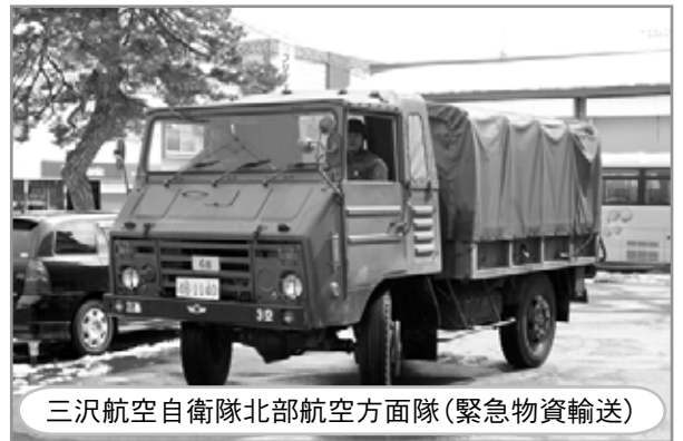
三沢航空自衛隊北部航空方面隊(緊急物資輸送)

同日の16時には、津波警報から注意報となったことから当町でも避難勧告に切り替え、引き続き情報収集と状況変化への注視を継続しました。17時20分には、町内全域の電力が復旧し、日常生活に近い状態にまでライフラインが回復するに至りました。