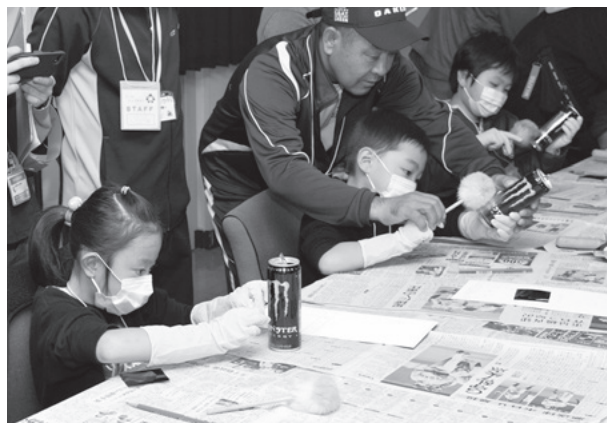
▲空き缶から指紋を採取する児童

職業体験終了後は、同時開催のキッズマーケットで、自分が働いて貰った給料でお菓子やおにぎりを買ったり、吹き矢体験や英会話教室などを楽しみ、児童は働くことの仕組みと大切さを学びました。