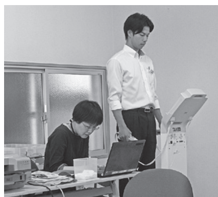
▲体組成測定を行う町職員