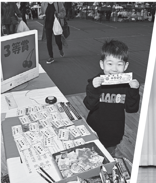
▲抽選が当たって喜ぶ子ども

来場者は、買い物や芸術文化、健康チェックなど、思い思いに秋の休日を満喫しました。