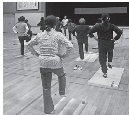
▲運動講座で片足立ちを行う参加者

目標を設定すると「ここまでがんばろう！」という気持ちをもてますので、皆さんも目標を設定して取り組んでみましょう！