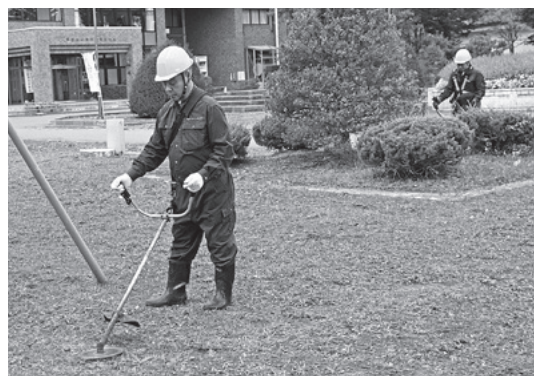
▲慣れた手つきで草刈りなどの作業を行っていました

参加した9名は、午前9時から午後3時までの間、敷地内で長く伸びた草を機械で刈り取ったり、植木の剪定作業を慣れた手つきで行っていました。