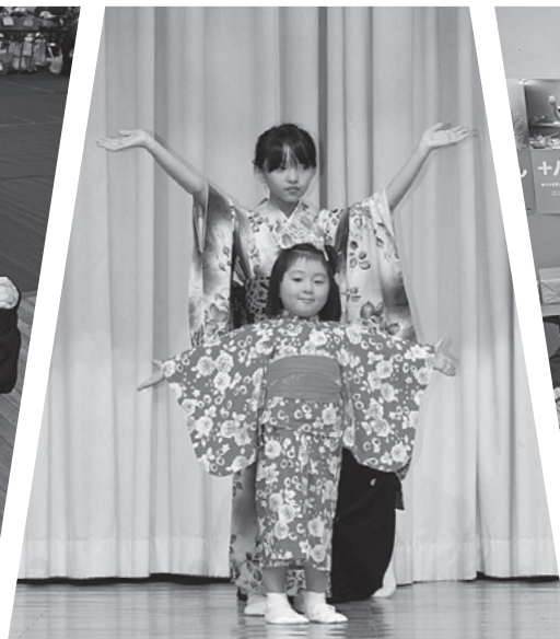
▲舞台発表では子どもの可愛い演技に大きな拍手