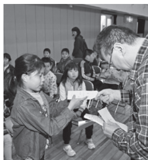
▲職業体験後「給料」が手渡されました