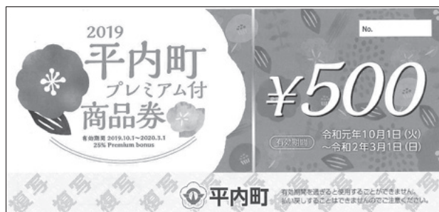
▲「平内町プレミアム付商品券」※サンプル

※「商品券購入引換券」の申請期限は12月27日(金)までですが、「平内町プレミアム付商品券(使用期限は令和2年3月1日(日))」は役場福祉介護課で令和2年2月28日(金)まで販売しています。