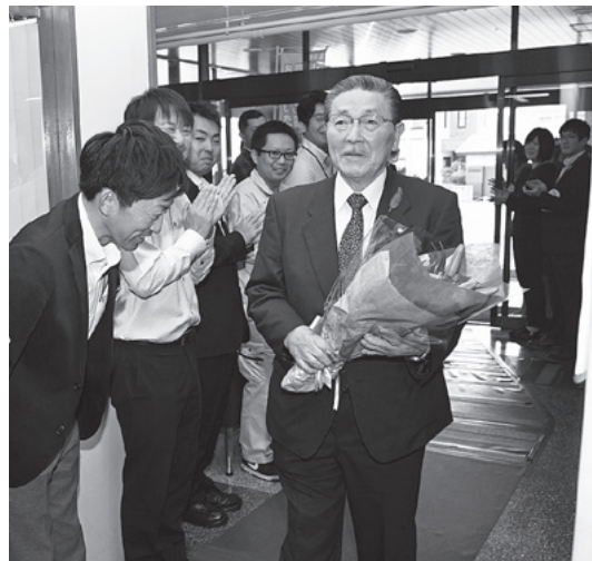
▲多くの職員から拍手で出迎えられて登庁する船橋町長

船橋町長の任期は、令和元年11月15日から令和5年11月14日までの4年間となります。