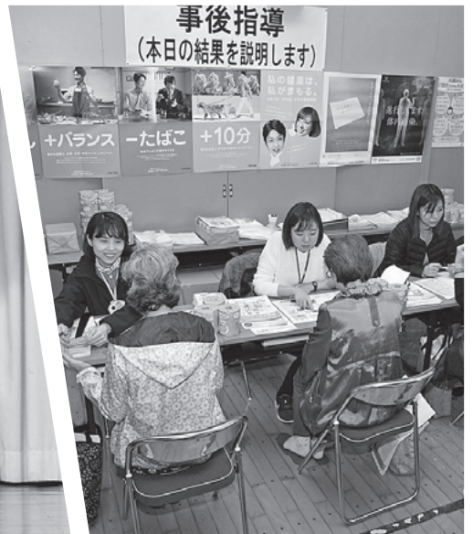
▲保健師の事後指導を受ける来場者