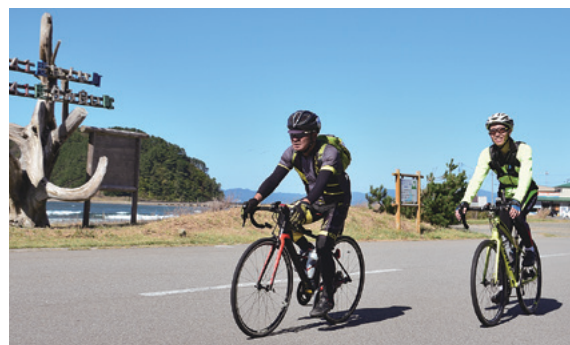
▲夏泊半島の海沿いを景色を楽しみながら駆け抜けました

秋田県から友人と一緒に参加した方に感想を聞くと「秋田も男鹿半島の海側を走るイベントがありますが、秋田は岸壁の上を走る感じなので、ここは海が近く、より海を感じられてとても気持ち良かったです。昼食のホタテもとても美味しかったです」と、笑顔で話してくれました。