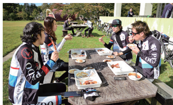
▲ホタテの貝焼きや手羽先など、ご当地グルメも大好評！