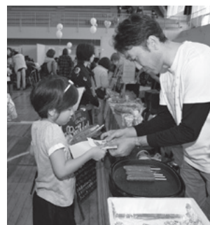
▲買物などで「給料」をつかう「消費体験」も好評でした