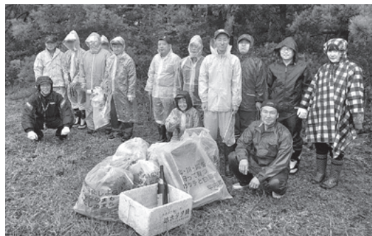
▲みんなで協力してゴミを拾いました

白鳥を守る会では、本格的に飛来するハクチョウの定点観察活動などさまざまな活動を行っておりますので、興味関心のある方は、ぜひご協力をお願いします。