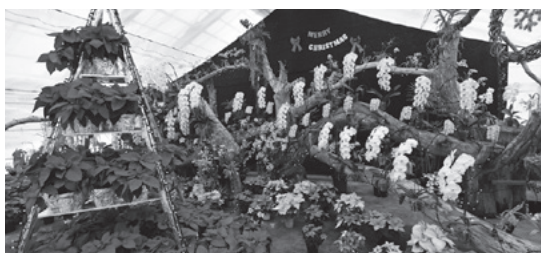
▲昨年の「冬の花展」より