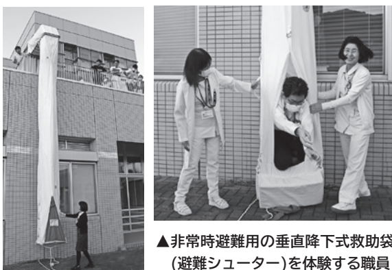
▲非常時避難用の垂直降下式救助袋(避難シューター)を体験する職員

安全な避難のためには、日頃の準備の大切さと火災予防に努めることが大事だという職員の方の防災意識の高まりを感じました。