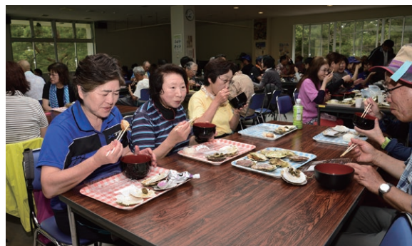
▲昼食では新鮮なホタテを使った料理が大好評