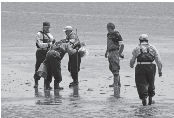
▲定点観測するための目安となるポールを設置

同会では、今後も定期的に定点観測を続け、コアマモの生息数の増減やそれに伴う白鳥の飛来などについての調査を継続していきます。