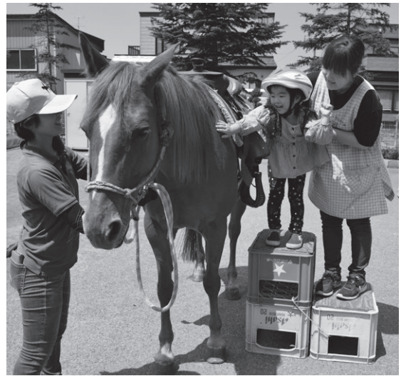
▲乗せてくれた馬に感謝の気持ちを込めて体をなでる園児

最後は、乗せてもらったお礼をかねて、それぞれ乗馬した馬ににんじんの餌やり体験を行った後、園児全員で「またきてねー」と名残惜しそうに手を振ってお別れをしました。