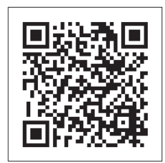
▲青森暮らしQRコード