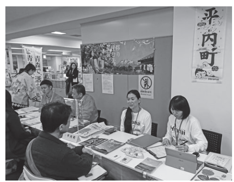
問 役場 企画政策課 企画政策係 Tel 718-1325(内線230)