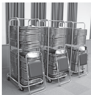
▲外童子町内会が整備したクリーンボックスと折りたたみイス