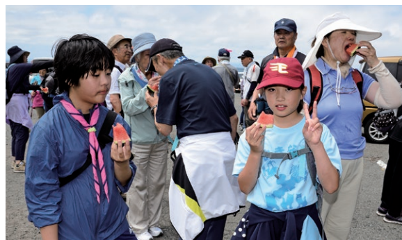
▲大島の休憩ではスイカが振る舞われました

六戸町から参加した方に話を聞くと「10回以上参加しているクラブの仲間誘われて今回初めて参加しました。夜越山の自然も海岸線の景色もすばらしく、昼食のホタテ汁や貝焼きもとても美味しく、来年も参加したいです」と、笑顔で話してくれました。