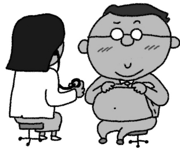
▲定期的に家族みんなで健(検)診を受けましょう！

特に子どものころからの生活習慣が大変大事ですので、良い生活習慣が身に付くよう保護者の皆さんのご協力をよろしくお願いします。