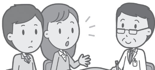
▲お気軽にご相談ください