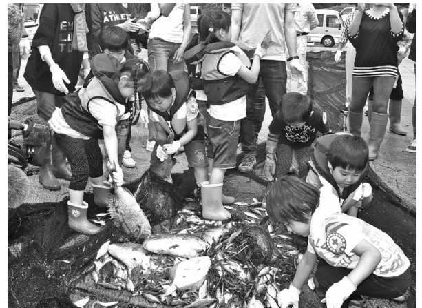
▲引き上げた網にかかった魚に興味して触れる園児たち

ライフジャケットを着た園児は、同研究会員や保護者とともに、「よいしょ、よいしょ」のかけ声で網をたぐりよせると、かかっていたタイやカレイなどの魚にみな興奮した様子で触れたり持ち上げたりしていました。