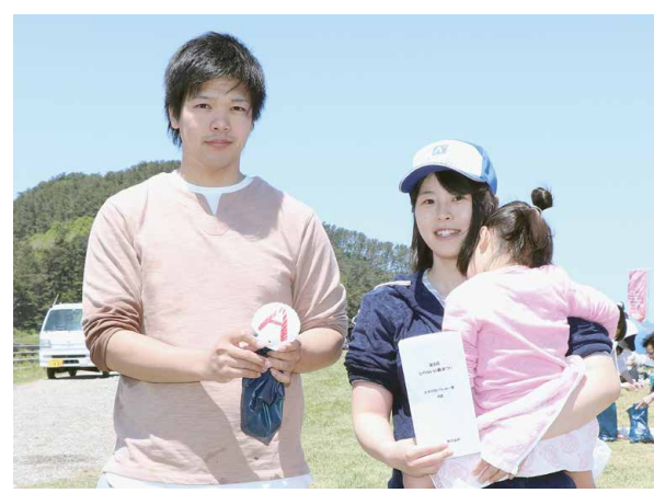
▲見事「A賞」のホタテを獲得した参加者

終了後は、採ったホタテをお土産に持ち帰るほか、無料で貸し出されたバーベキューコンロで貝焼きを楽しむ家族連れも多くみられ、初夏の一日を満喫していました。