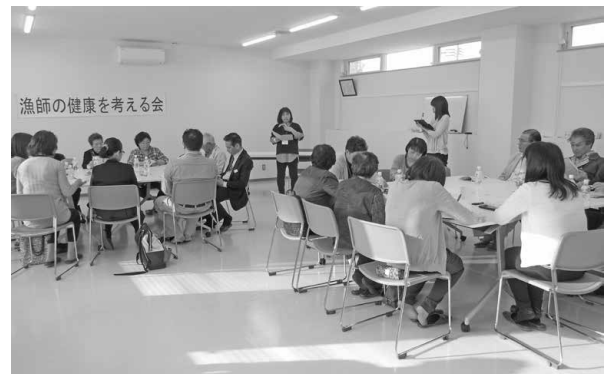
▲今回も活発な意見交換が行われました

当町の平均寿命向上のためには、「働き盛りの地区の男性にも参加してほしい」との意見があり、今後、行政協力員を中心に漁業組合や消防団に働きかけ、勉強会への参加を促し、「健康意識・健(検)診受診率・平均寿命」の向上を目指していきます。