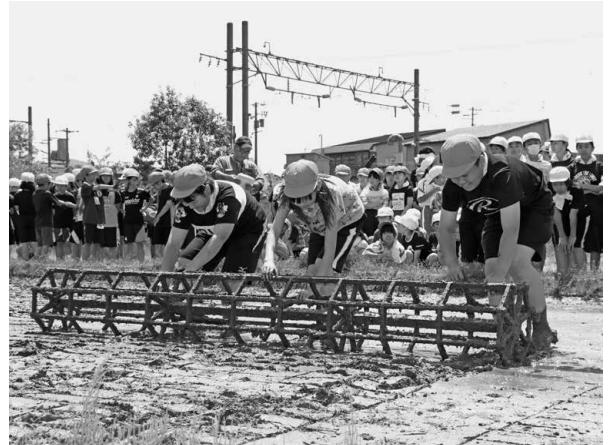
▲田植え定規を転がして、苗を植えやすいよう型枠をつける児童

今年は、田植え定規を使い、苗を真っすぐ植えるための目印をつける『線引き』作業も行われ、児童は慣れない作業に悪戦苦闘しながらも、「楽しい!」「気持ちいい!」と大きな声をあげ、泥だらけになりながら一生懸命もち米の苗を植えていきました。秋には稲刈りを行い、収穫したもち米で「もちつき集会」を行う予定とのことです。