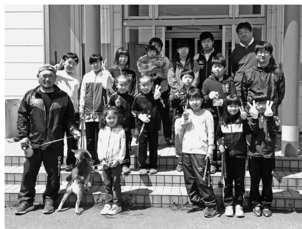
▲清掃活動を実施した「ふじさわ子供会、育成会」のメンバー

最後は「ポイ捨てしない!」「みんなで町内をきれいに!」ことを誓い合い、清掃活動を終了しました。