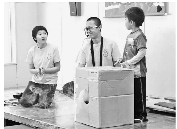
▲ダンボールを利用した「空気砲」の実験をする園児(右)

同部の生徒からは、「子どもたちと触れ合うのは、自分たちも楽しいし、力になる」という感想が聞かれました。