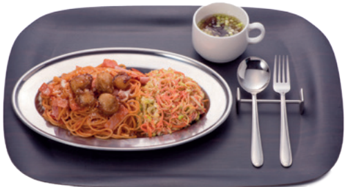
唐揚げホタテの「昔懐かしナポリタン」 880円(税込)

▲国民パスタの代名詞「ナポリタン」にベビーホタテの唐揚げをトッピングしました。昭和の時代に一世を風靡したナポリタン。昔懐かしさと安さがウリです!