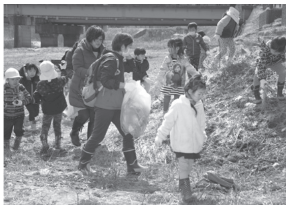
▲放流後、川原のゴミをみんなで拾いました