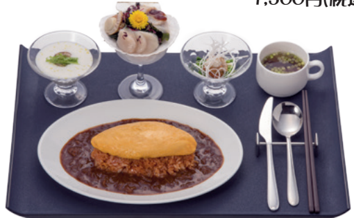
ホタテ刺身パフェ&新・タンポポオムライス 1,500円(税込)

▲ふわとろオムレツで包んだケチャップライスとデミグラスソースにホタテをたっぷり使用しました。「ホタテの刺身パフェ」は和洋中3つの味わいを楽しめます!