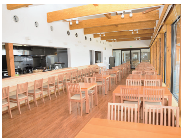
▲ここでしか食べられない創作ホタテ料理が堪能できます(54席)