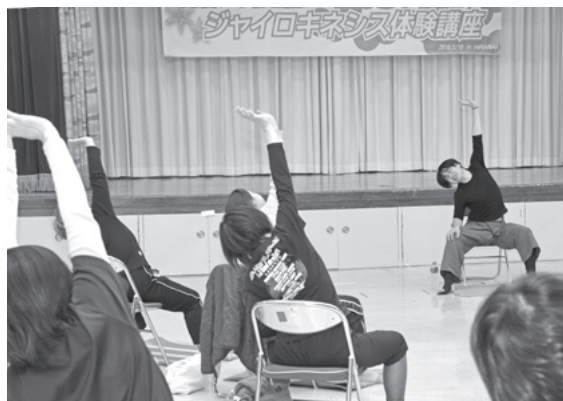
▲腰痛の緩和や姿勢の改善にも効果的とのこと