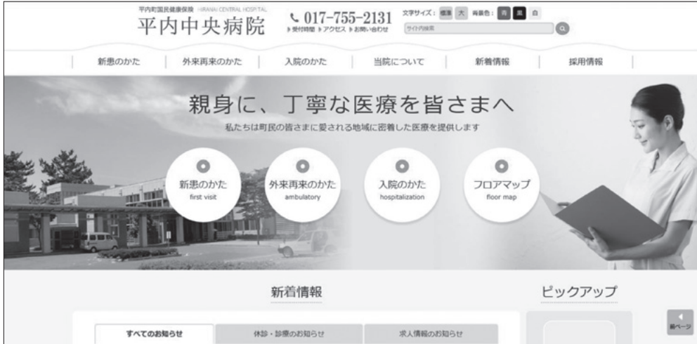
▲平内中央病院の新しいホームページ画面

これまで、町ホームページ内にて当院の情報などを掲載しておりましたが、この度、新しくホームページ ( https:// hiranai-chp. jp/ ) を立ち上げ、構成やデザインを全面的に刷新しました。