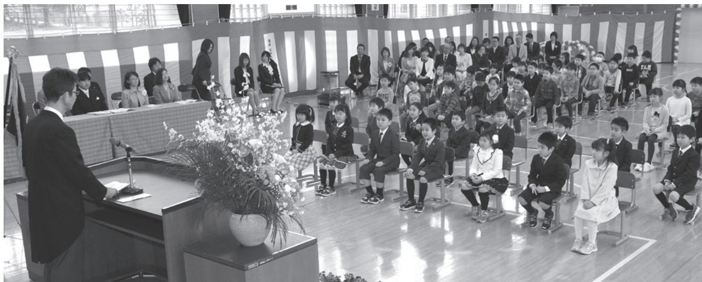
▲校長先生の話をおとなしく聞く山口小学校新入学児童