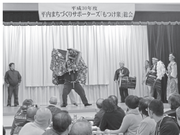
▲山口地区の住民と親睦を深めました

『もつけ衆』は平成28年の発足以来、町内の様々な行事においてボランティア活動を積極的に行っており、今回の総会は町内の各地域との交流を深めることを目的に企画され、会場である山口地区の住民を多数招待し、総会前にはトランプ大会を、また総会後には山口有志会による権現舞の披露と懇親会が行われ、親睦を深めていました。「もつけ衆」は新年度も様々な行事への参加を予定しています。