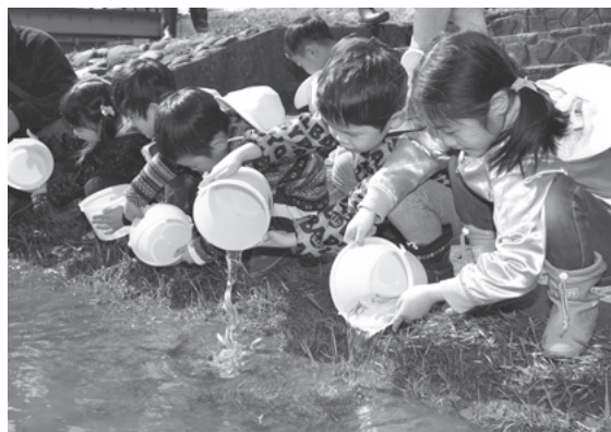
▲サケの稚魚を放流する園児

稚魚は3～5年後に成長して戻ってくる予定で、園児たちは、サケがたくさん戻ってくるようにと願いを込めながら、川原に落ちているゴミを友達と競いあいながらたくさん拾っていました。