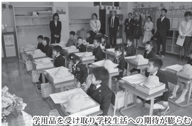
学用品を受け取り学校生活への期待が膨らむ