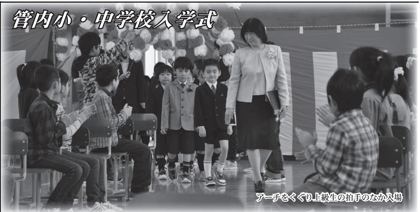
アーチをくぐり上級生の拍手のなか入場