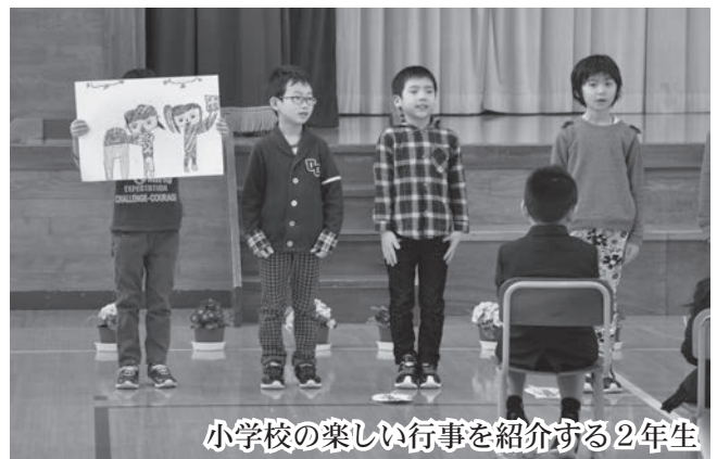
小学校の楽しい行事を紹介する2年生