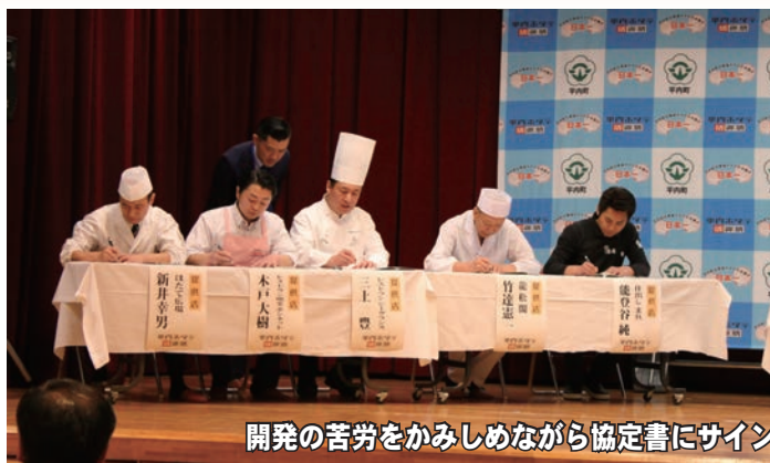
開発の苦勞をかみしめながら協定書にサイン

各店とも価格は1,200円。平内町漁協の協力により、通年で新鮮な活ホタテを味わうことができる活ホタテ膳で広く町内外にアピールしていきます。