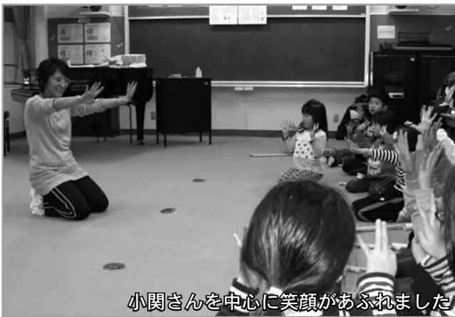
小関さんを中心に笑顔があふれました