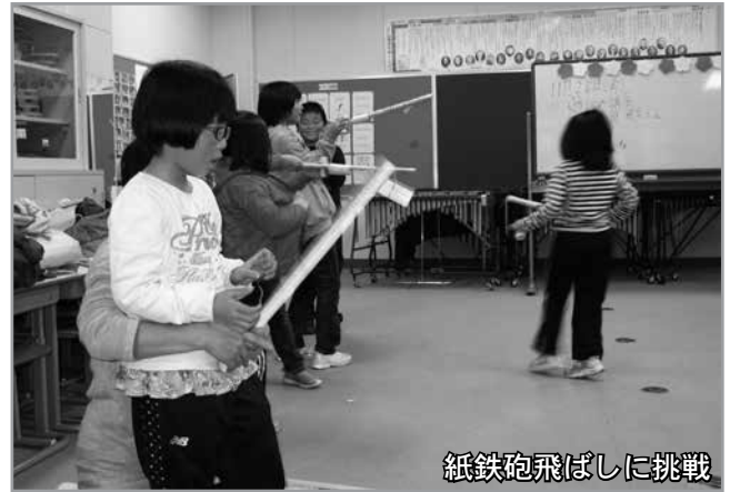
紙鉄砲飛ばしに挑戦

に小さくしてそれに乗ったり、滑ったり、回ったりの運動や2人1組になり背中合わせで素早く新聞紙を取る競争、紙鉄砲飛ばしと1時間半にわたり室内でもできる遊びや運動が紹介されました。子ども達は紙鉄砲を作る際には講師の話を真剣に聴き、慣れない作業はお互いに協力したり、どうすれば紙鉄砲が遠くまで飛ばせるかなどを考えて行動する姿が見られました。