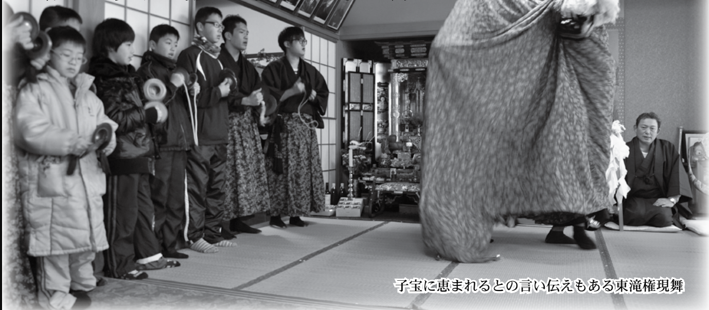
子宝に恵まれるとの言い伝えもある東滝権現舞