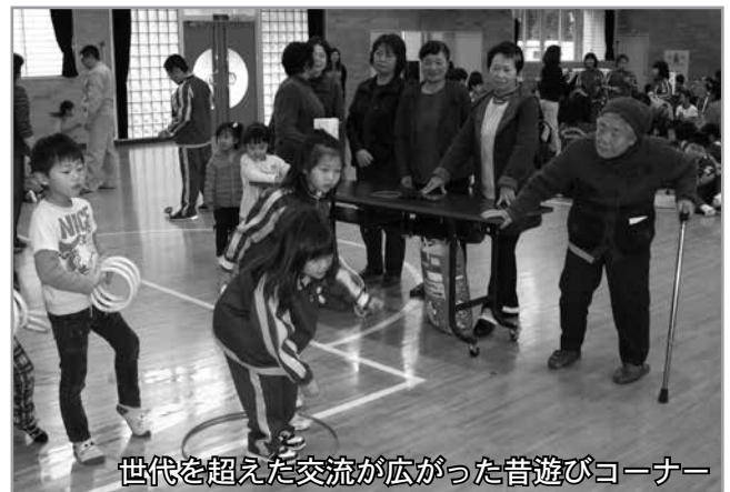
世代を超えた交流が広がった昔遊びコーナー