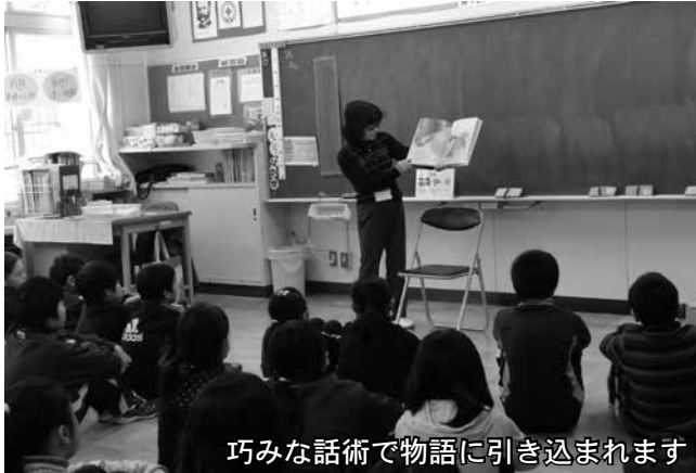
巧みな話術で物語に引き込まれます

読み聞かせには想像力や言語能力を高め、感情を豊かにするなど、情操教育に高い効果があるとされており、この日も、教職員の方と一緒に朝のあいさつ運動に加わり笑顔で声掛けをしながら児童を迎えた会員の皆さんは、授業前の15分間を活用して「のんちゃん和白鳥」など絵本の読み聞かせを行いました。