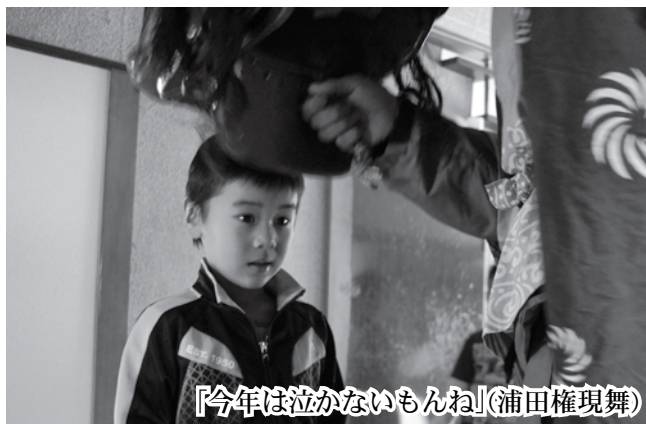
「今年は泣かないもんね」(浦田権現舞)

1月1日(木)には、浦田、稲生、東滝などで権現舞の門付けが行われ、一軒一軒を廻って家族の無病息災を願いました。この日は、時折晴れ間がのぞくもののポタ雪が深々と降る悪天候で、舞手や囃子の方々は頭に雪を積もらせながら一生懸命に各戸を訪ね、勇壮な舞を舞いました。