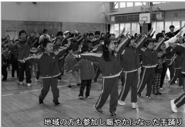
地域の方も参加し賑やかになった手踊り

また、昔遊びコーナーでは、おはじきやけん玉など、それぞれの遊び担当の児童が低学年に遊び方を教える