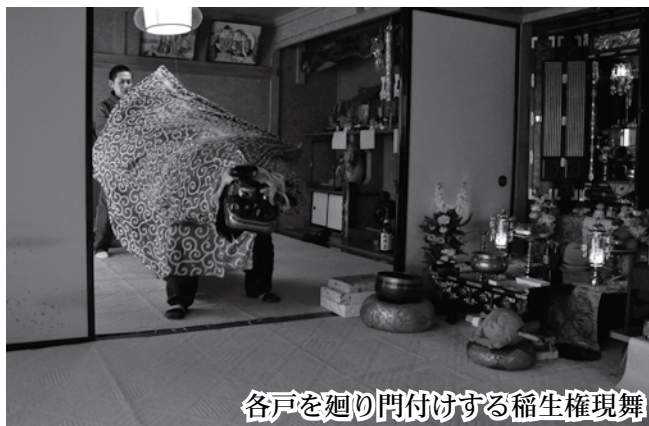
各戸を廻り門付けする稲生権現舞

平内町史によると、町内の権現舞は14団体ほどあったようですが、舞手の負担が大きいことや、担い手不足などが影響して自然消滅してしまったり、その年の門付けを断念せざるをえない地区も出てきています。