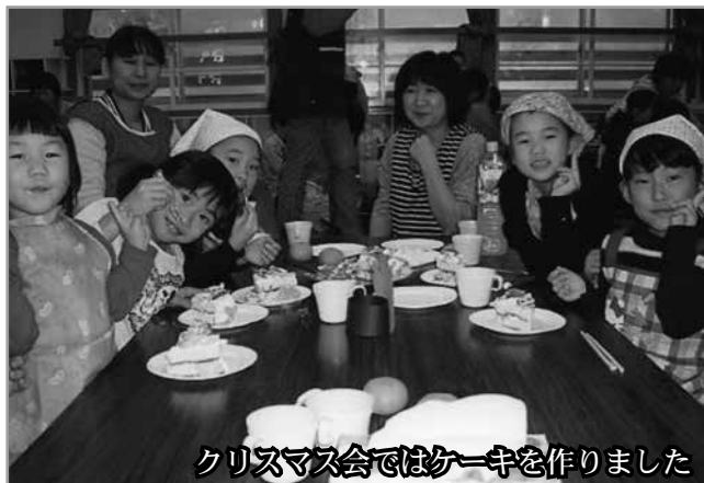
クリスマス会ではケーキを作りました