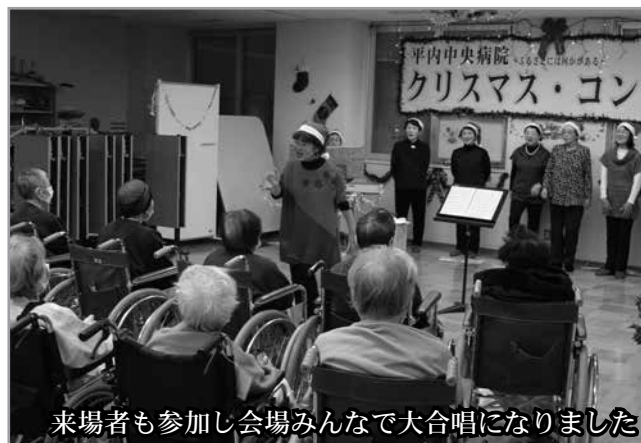
来場者も参加し会場みんなで大合唱になりました