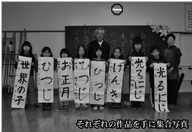
それぞれの作品を手に集合写真

書き初めの後には、これも恒例となっているくじ引きがあり、昔懐かしい「あん玉」や「ラーメンくじ」が行われ、児童も指導者も一緒になり楽しみました。