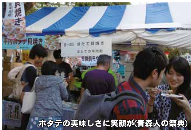
ホタテの美味しさに笑顔が(青森人の祭典)

評判は上々で、「しょうゆをかけなくてもこんなに美味しいなんて」、「味もさることながら安さにびっくりした」といった感想が聞かれたほか、在京の県出身者の方は「懐かしい青森のホタテの香りだ」と目を細めていました。