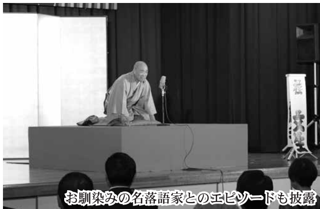
お馴染みの名落語家とのエピソードも披露

竹山流津軽三味線と落語。ジャンルは異なれど、伝統が織りなす技巧の数々に会場は笑い、うなずき、どよめき、時間を忘れて耳を傾けていました。