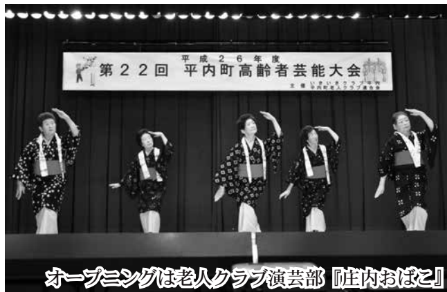
オープニングは老人クラブ演芸部『庄内おぼこ』

11月16日(日)、町勤労青少年ホームでいきいきクラブ平内(平内町老人クラブ連合会)主催の高齢者芸能大会が開催されました。