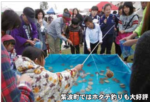
紫波町ではホタテ釣りも大好評

首都圏での町のPRイベントには毎回、在京の平内町ふるさと会の方々がたくさん応援に来てくださっています。今回も二日間にわたり販売や行列の整理に遅くまで手伝っていただきました。地元のホタテのおいしさを身をもって知っている会の方々の声に、多くの方が足を止め、たくさんのホタテを食べていただきました。