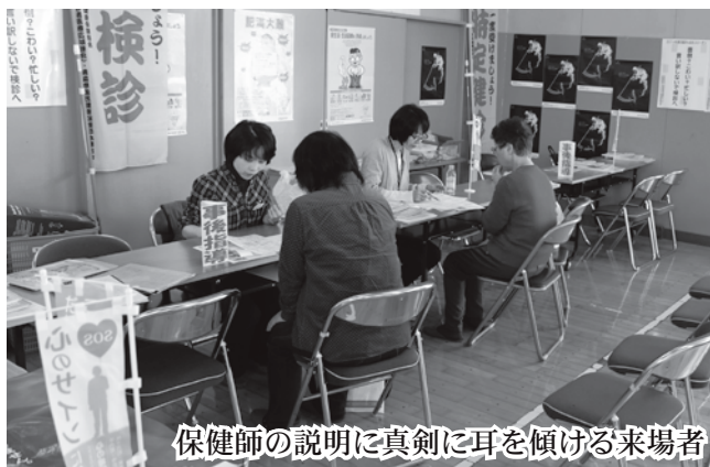
保健師の説明に真剣に耳を傾ける来場者

平内町食生活改善推進委員会の食生活改善コーナーでは、高血圧予防をテーマに減塩みそ汁と野菜がたっぷりとれる副菜の試食が提供され、来場者からは「試食して、味が濃い方だと分かった」、「これからうす味にしていきたい」などといった声が聞かれ、減塩について考えるきっかけとなったようでした。