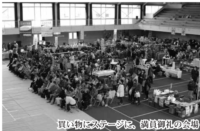
買い物にステージに、満員御礼の会場

ステージでは、レクダンスクラブショーや幼児のショーなど様々な企画が会場を華やかに盛り上げ、買い物に訪れた来場者を笑顔にしました。