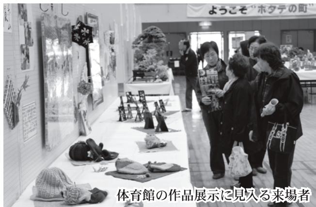
体育館の作品展示に見入る来場者

絵画や盆栽、写真などの作品が体育館のフロアいっぱいレイアウトされた展示部門では、並べられた作品の技術の高さや趣の深さに来場者は目を奪われていました。展示作品の中には管内小・中学校から出品された図画、習字もあり、優秀な作品には金・銀・銅の各賞が授与され、26日に同会場で表彰されました。