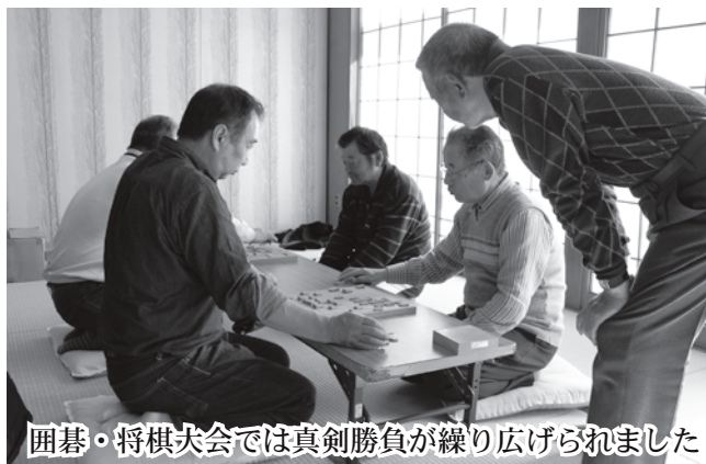
囲碁・将棋大会では真剣勝負が繰り広げられました

小湊小・中合同の吹奏楽は、それぞれの学習発表会、文化祭と今回の町民文化祭に加え、翌週の商工会びっくり市でも演奏を披露し大活躍の秋となりました。