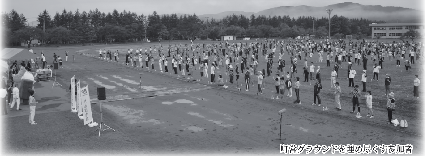
町営グラウンドを埋め尽くす参加者