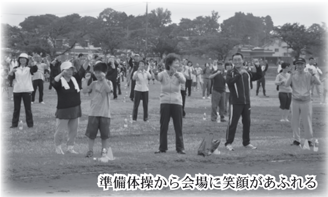
準備体操から会場に笑顔があふれる

前日までの雨により所々水たまりができ、屋外での開催が危ぶまれましたが、グラウンド整備や排水溝の泥上げなど関係者らの尽力により無事開催にこぎつきました。当日は目標の1000人を超える参加者が集まり、平内町から元気あふれるパワーが日本全国に生放送されました。