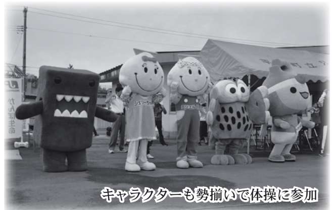
キャラクターも勢揃いで体操に参加

今回の体操会は早朝にもかかわらず、大勢の町民の皆さんに参加いただきありがとうございます。これを契機とし、今後もさらなる推進を図って参ります。10月には小湊小学校の6年生を対象にラジオ体操の出前授業を予定しているほか、一般町民を対象にした大規模な講習会も企画中です。皆さん一緒に体力の向上と健康の保持や増進を図り、地域ぐるみで健康なまちづくりを目指しましょう！！