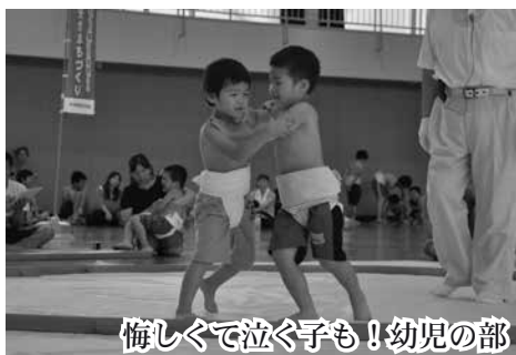
悔しくて泣く子も！幼児の部