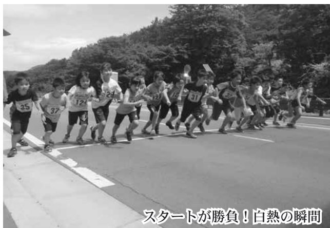
スタートが勝負！白熱の瞬間