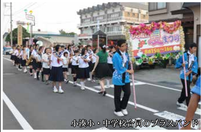
小湊小・中学校合同のブラスバンド