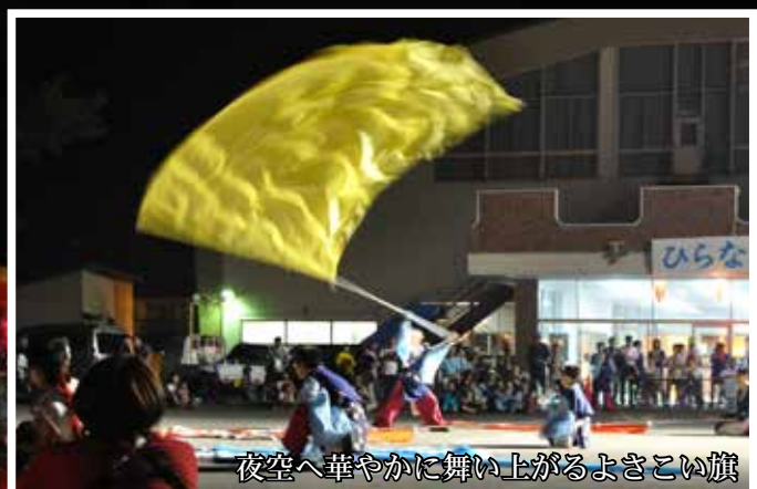
夜空へ華やかに舞い上がるよさこい旗