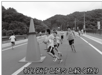
折り返すと延々と続く登り