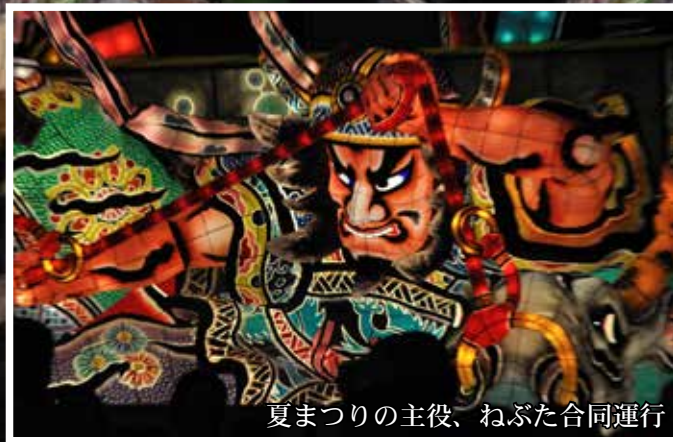
夏まつりの主役、ねぶた合同運行