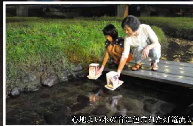
心地よい水の音に包まれた灯籠流し