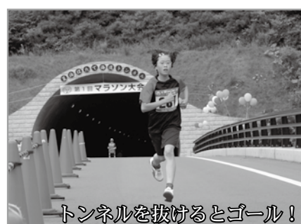
トンネルを抜けるとゴール！