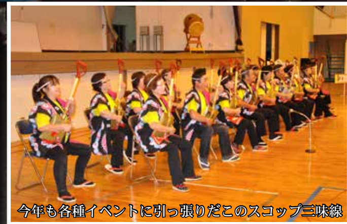
今年も各種イベントに引っ張りだこのスコップ三味線