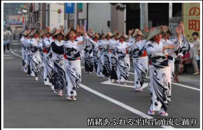
情緒あふれる平内音頭流し踊り