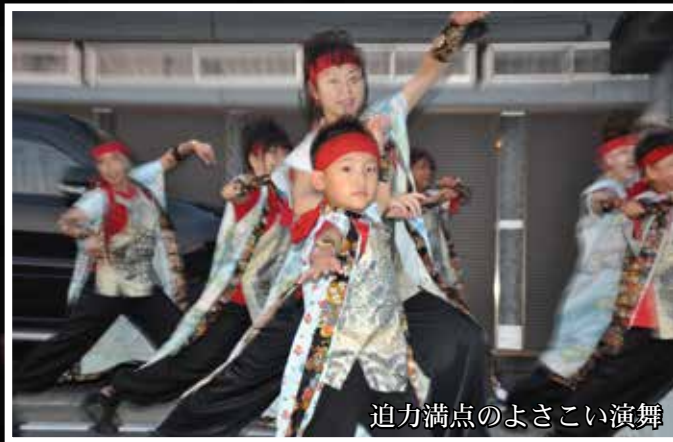
迫力満点のよさこい演舞