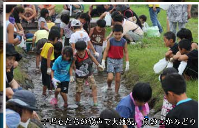
子どもたちの歓声で大盛況、魚のつかみどり