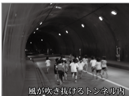
風が吹き抜けるトンネル内