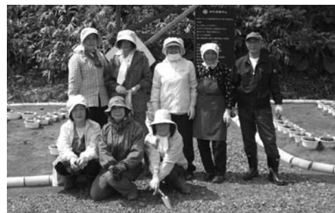
商工会女性部の皆さん

植えられた真っ赤なサルビアと黄色のマリーゴールドが小湊駅の利用者を出迎えてくれることでしょう。