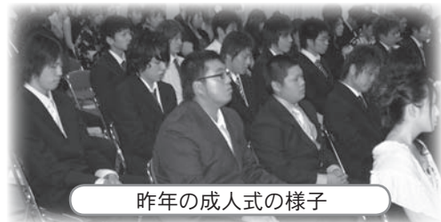
昨年の成人式の様子

【その他】平内町に住所のある方には、案内を個別に発送します。なお、平内町出身で町に住所のない方でも参加できます。