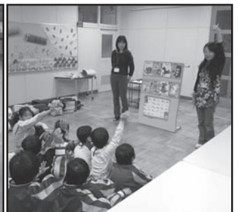
山口小学校(左)と東小学校(右)の様子