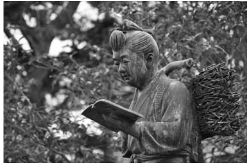
尊徳先生も寂しそう？