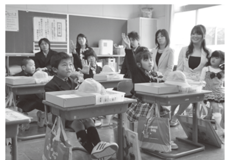
元氣よく手を上げよう！

また、PTA等から文房具や黄色の安全帽が贈られるなどし、新入生たちは小さな身体からあふれんばかりの希望を胸に、新たな生活のスタートを切りました。