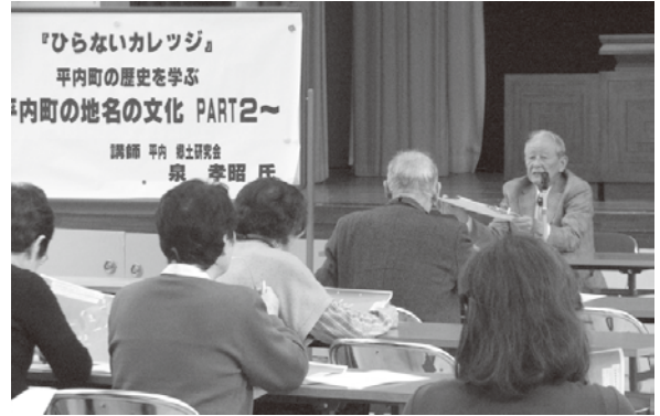
平内町の地名の文化(H22.11月開催)