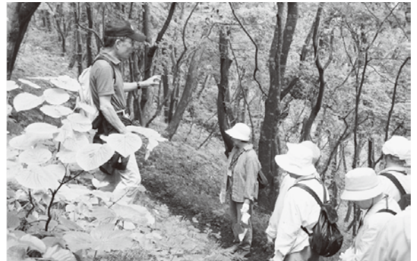
大島の植物観察(H22.6月開催)