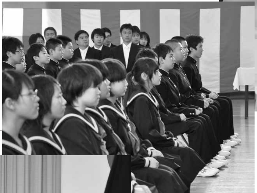
(上) 期待と不安で緊張の表情

少し大きめの制服に身を包み、背筋を伸ばして体育館へ入場する姿は「まだまだ成長するぞ」という気持ちを感ぜさせるものでした。