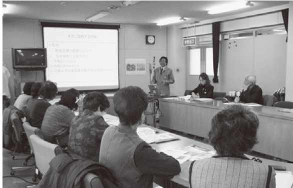
暮らしと電気(H22.12月開催)