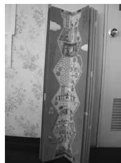
1mの絵本 「100かいだてのいえ」