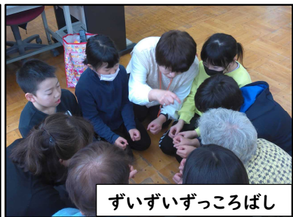
ずいずいずっこばし