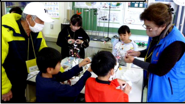
物作り「小正月飾り」