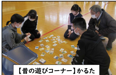
【昔の遊びコーナー】かるた