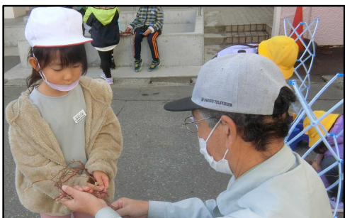
1年生の鉢片付けとあさがおリース作り