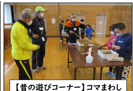
【昔の遊びコーナー】コマまわし