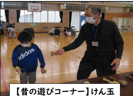
【昔の遊びコーナー】けん玉

地域の方から「子ども達が楽しんでくれて、良かったです」「楽しく過ごさせていただきました」「また来年参加したいです」などの感想がありました。