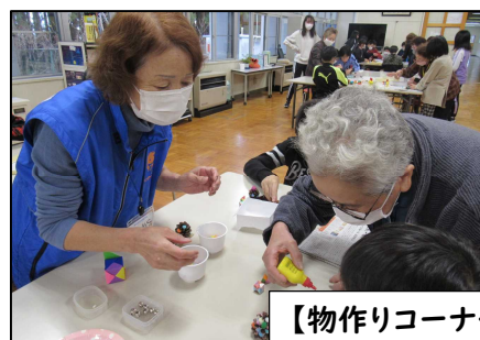
【物作りコーナー】物作り体験