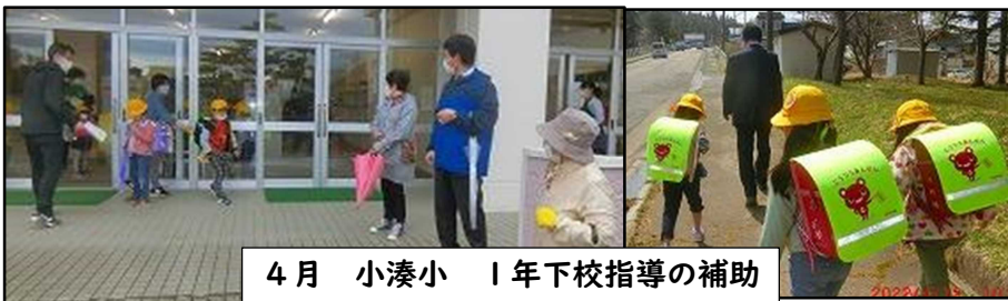
4月 小湊小 1年下校指導の補助