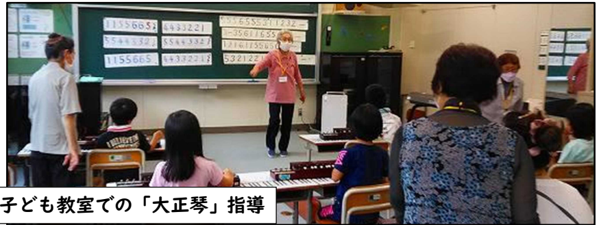
6月～ 東小 子ども教室での「大正琴」指導