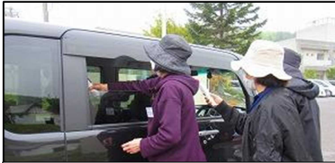
5月 西平内中 運動会の受付 体温チェックの様子