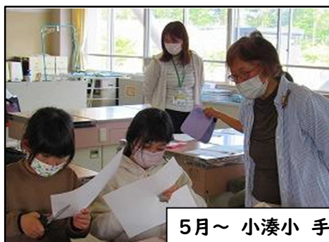
5月～ 小湊小 手芸クラブの支援