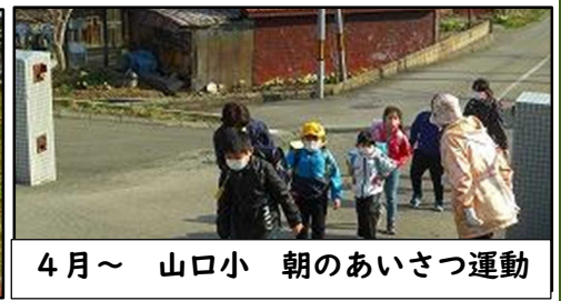
4月～ 山口小 朝のあいさつ運動