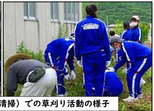
7月 小湊中 クリーン作戦（生徒による平内町学校歴史伝承庫清掃）での草刈り活動の様子