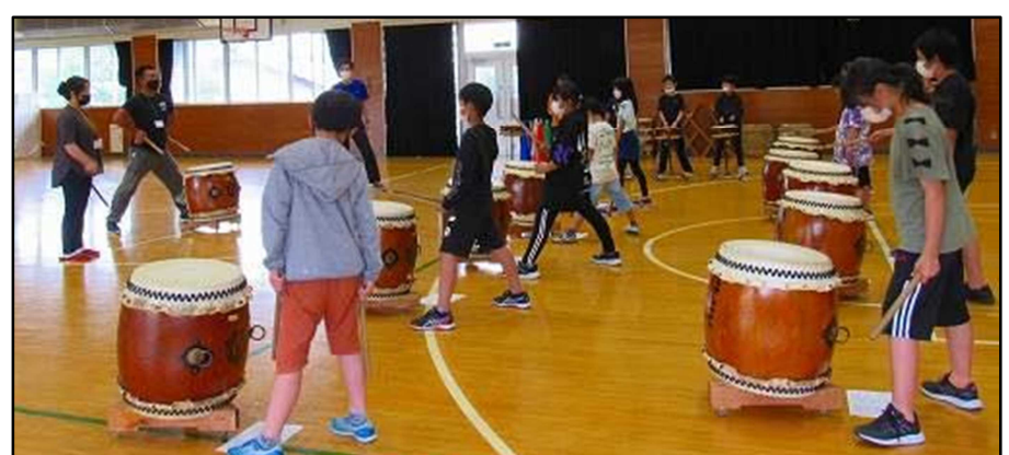
7月～ 山口小 ほたて太鼓の指導 学習発表会に向けて練習の様子