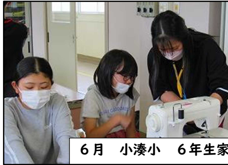
6月 小湊小 6年生家庭科学習支援 ミシンの補助