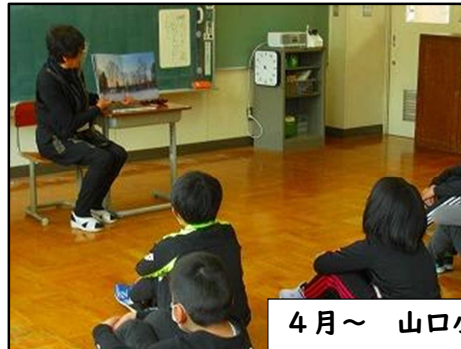
4月～ 山口小 読み聞かせの様子