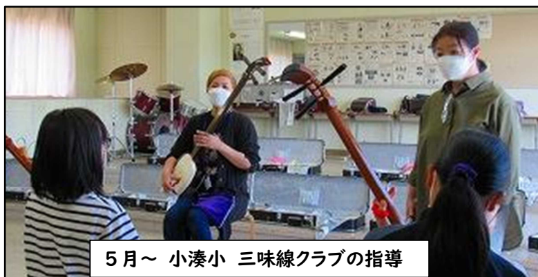
5月～ 小湊小 三味線クラブの指導