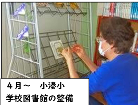
4月～ 小湊小 学校図書館の整備