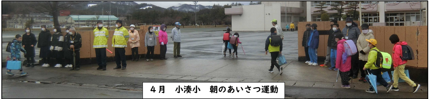
4月 小湊小 朝のあいさつ運動

平内町では、「学校が必要とする活動」と「地域の力」をマッチングして、地域ぐるみで子どもたちを育てる地域学校協働活動を昨年度から本格的に行っています。今年度1学期の活動をご紹介します。