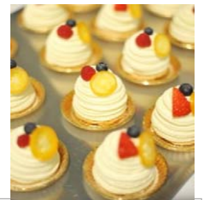
開場で振る舞われた オリジナルケーキ

私たちは、このイベントの成功を出発点として、平内町の持つ自然・文化・人の魅力を新しい視点で見直し、若者ネットワークの充実や町の魅力発信に取り組んでいきたいと考えています。町民の皆さまにもいっそうのご理解・ご協力をいただけますよう、あらためてお願い申し上げます。