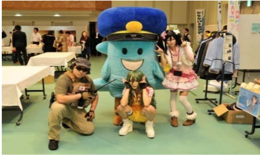
青い森鉄道ブースの前で「モーリー君」と記念撮影するコスプレイヤーたち